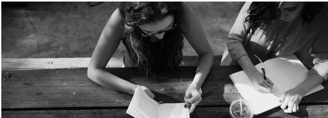
Mujeres estudiantes.

Educación Primaria así como incrementar la finalización de la Educación Secundaria Obligatoria.