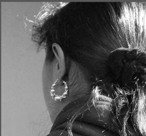
Mujer gitana.

Esto se percibe ya que hay un 15% más de familias con niñas que con niños que pretenden que sus hijas finalicen los estudios universitarios. Para ellos prefieren la Formación Profesional. Estos datos contrastan mucho si nos fijamos en una generación más atrás, es decir, en los padres y madres de los niños encuestados. En este caso son las mujeres las que habrían abandonado sus estudios antes que los hombres. En total un 68,4% de madres no habrían acabado sus estudios de Primaria y sólo un 2,2% tendría Bachillerato o Formación Profesional.