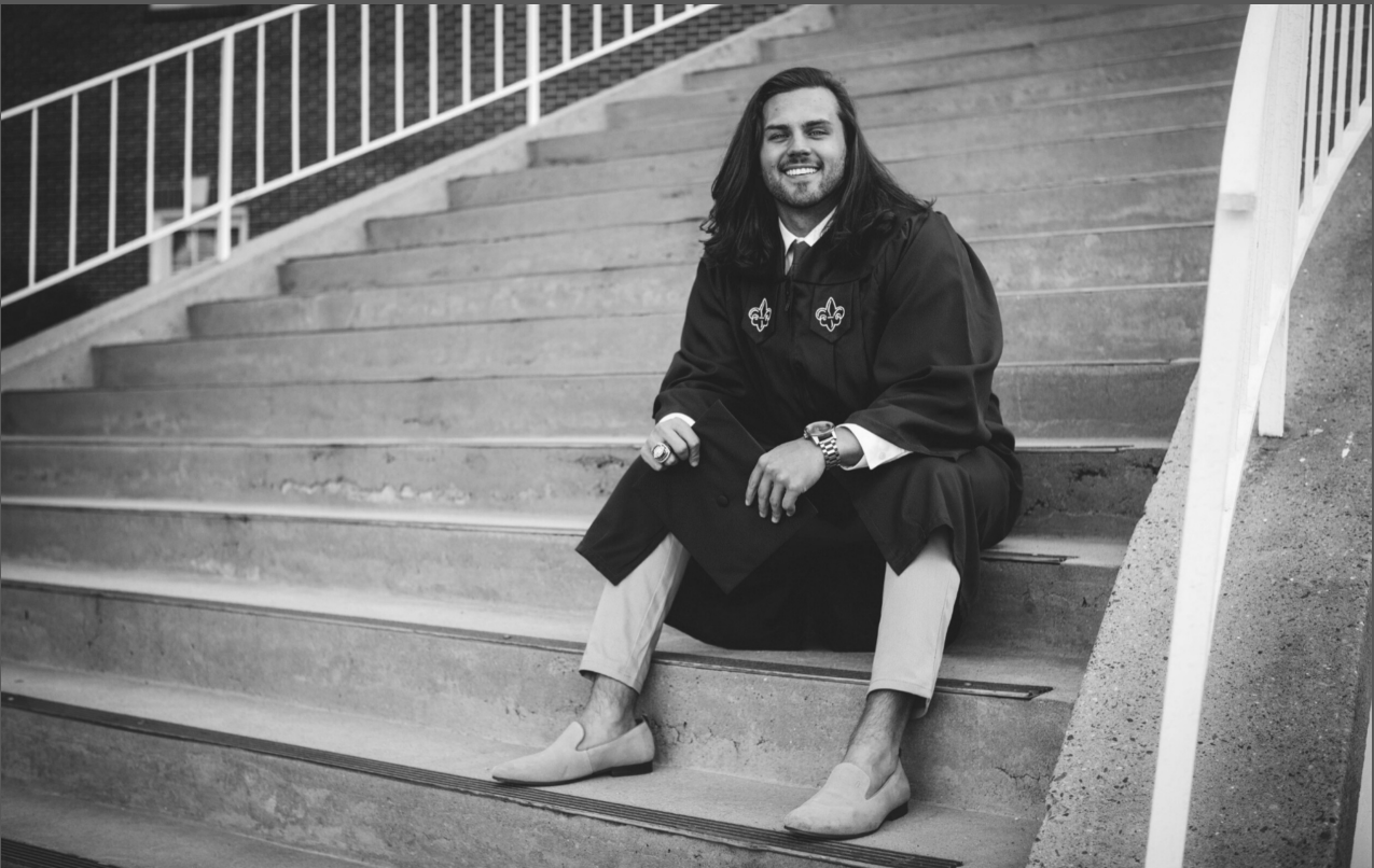
Hombre gitano graduado.

Los gitanos y la Universidad es una relación de la que apenas se habla por ser una minoría dentro de otra minoría.