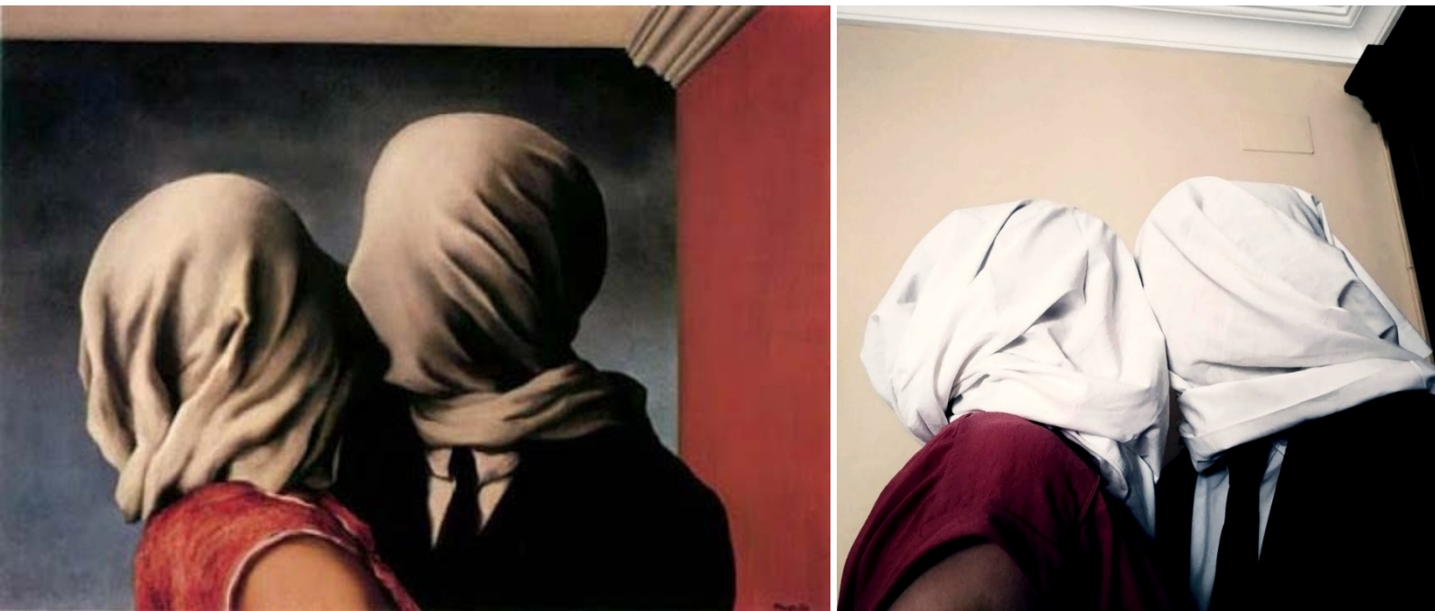
«Arte en la cuarentena» (2020). Antonio Calero Ceas. Alumno del IES Heliche. Obra licenciada bajo Creative Commons (BY-NC-ND) 4.0. Reinterpretación de la obra "Los amantes" (1928), de René Magritte.