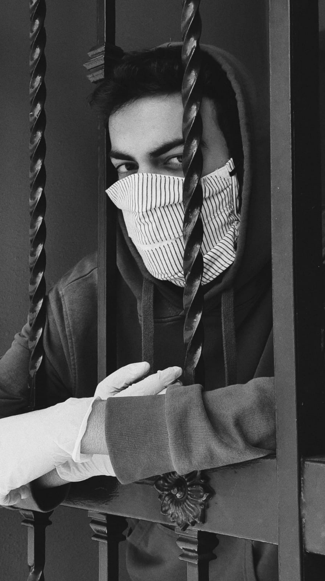
#PHEdesdemibalcón (2020). Alejandro García Rodríguez. Alumno del IES Heliche. Obra fotográfica licenciada bajo Creative Commons (BY-NC-ND) 4.0