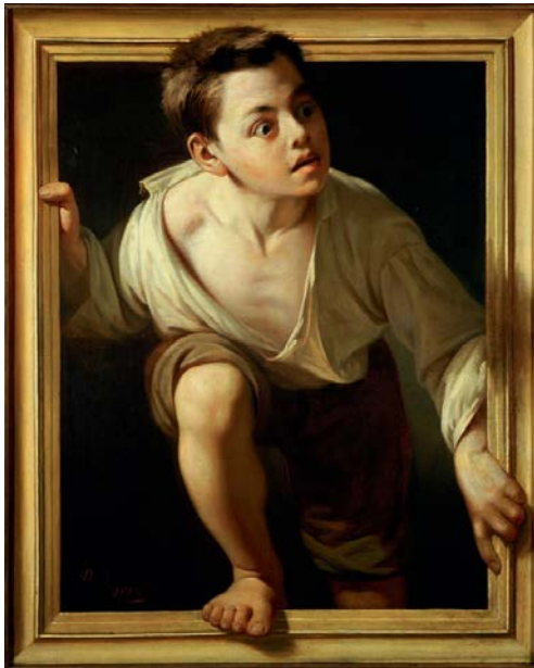
«Arte en la cuarentena» (2020). Esteban Torres Gutiérrez. Alumno del IES Heliche. Obra licenciada bajo Creative Commons (BY-NC- ND) 4.0. Reinterpretación de la obra "Huyendo de la crítica" (1874), de Pere Borrell del Caso.