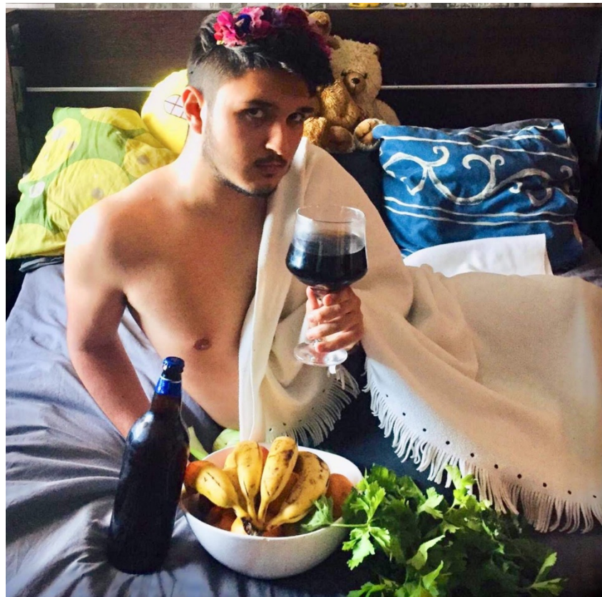
« Arte en la cuarentena » (2020). Naim Real Garrido. Alumno del IES Heliche. Obra licenciada bajo Creative Commons (BY-NC-ND) 4.0. Reinterpretación de la obra "Baco" (1598), de Caravaggio.