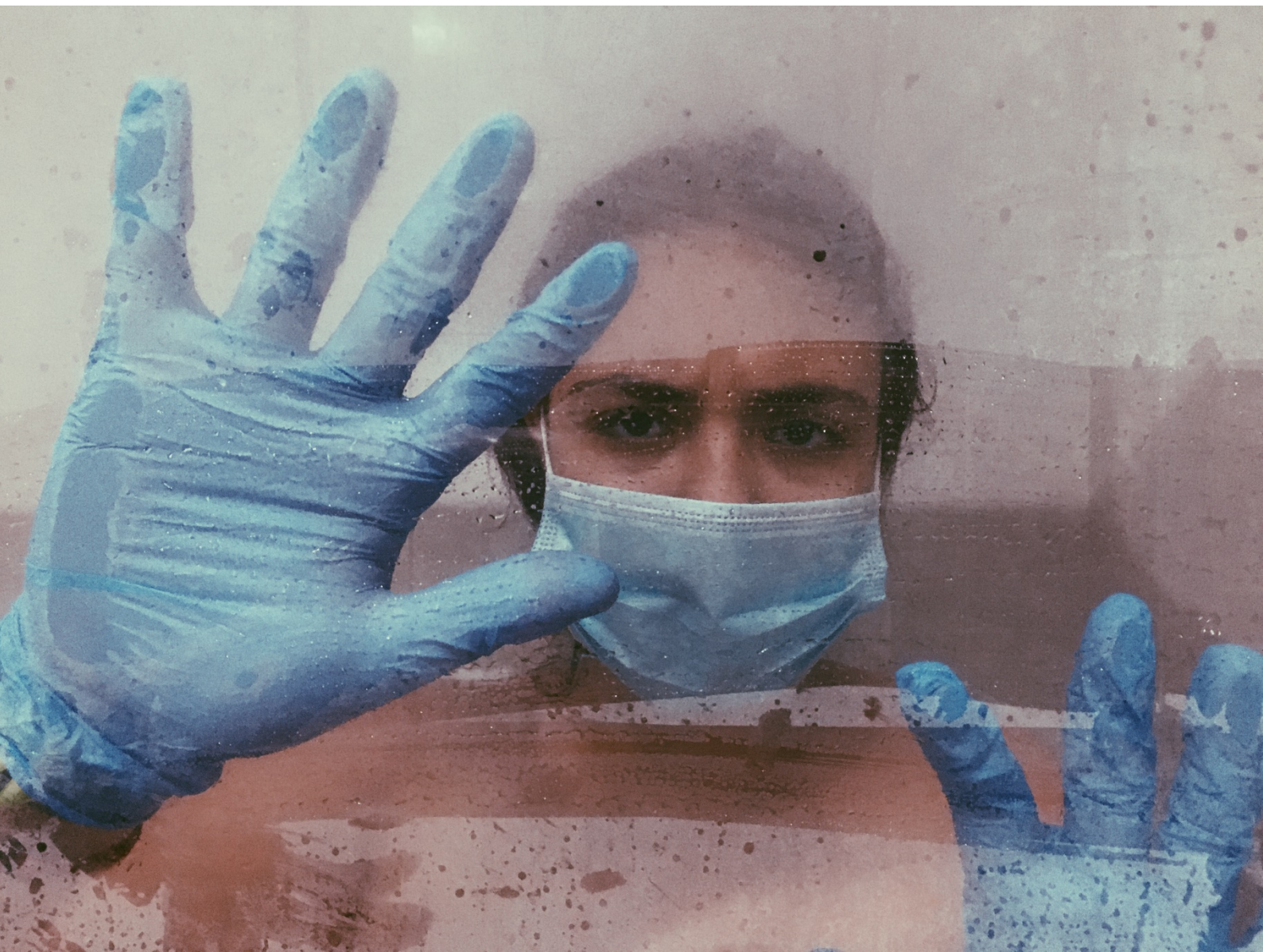
#PHEdesdemibalcón (2020). Paula Silva Ribera. Alumna del IES Heliche. Obra fotográfica licenciada bajo Creative Commons (BY-NC-ND) 4.0