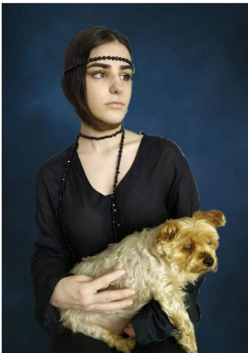
«Arte en la cuarentena» (2020). María Riego Romero. Alumna del IES Heliche. Obra licenciada bajo Creative Commons (BY-NC-ND) 4.0. Reinterpretación de la obra "La dama del armiño" (1490), de Leonardo da Vinci.