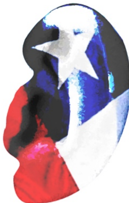
Figura 1. Obra propia de "Sin educación artística inclusiva... estamos muertos IVa" (2011). Arte digital.

y la escultura, no pueden expresarse sin grandes pérdidas. Por lo tanto, los mensajes visuales se pueden transmitir completamente solo por medio de sus colores y formas, que a su vez suscitan respuestas kinestésicas 3 y sinestéticas 4 , para las cuales apenas existe un vocabulario (Moga, Burger, y Winner, 2000; Scharfstein, 2009; Winner, Goldstein y Vincent-Lancrin, 2014; Winner, 1993). Por tanto, esas cuestiones estéticas y artísticas son capaces de transmitir sus intereses personales y prejuicios, así la comunicación verbal y no verbal pueden obstaculizar y dificultar la apreciación artística.