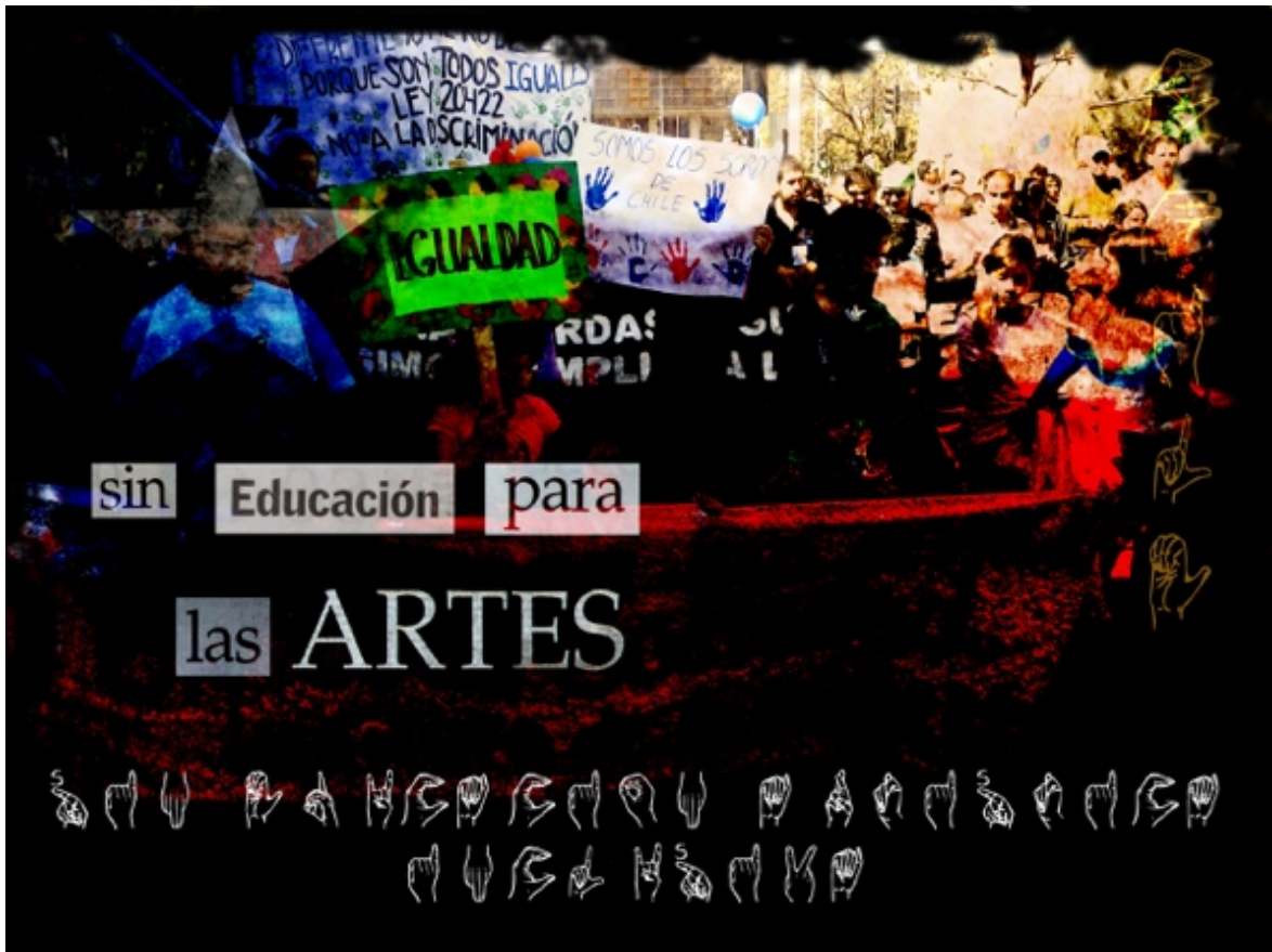
Figura 2. Obra propia de "Sin educación artística inclusiva... estamos muertos II" (2011). Arte digital. Imagen propia bajo licencia CC BY-NC-ND 4.0