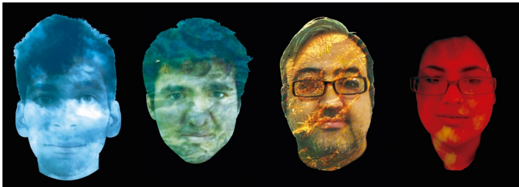
Figura 8. Obras propias de "Los cuatros elementos: Aire, Agua, Tierra y Fuego" (2012). Fotomontaje digital en impresión lambda y foam. 42 x 60 cm. (por cada obra). Imágenes propias bajo licencia CC BY-NC-ND 4.0

inclusión, discriminación en la vida situacional de exclusión laboral, vulnerabilidad y precario económico, frecuentemente en el quehacer artístico. Es muy importante la función social del arte en el desarrollo cultural. Un ejemplo autobiográfico es la muestra individual de "Identidad deteriorada en memoria social y ambiental" (2018) en Santiago de Chile (Figura 8 y 9). Esta exposición, compuesta por 25 retratos intervenidos digitalmente para recrear confusas condiciones ambientales y sociales, genera limitaciones como el estigma —marca o señal en el cuerpo-, que lleva al ser humano a esforzarse por hacer menos visibles y responder a las demandas construidas y transmitidas por la sociedad a través de la memoria, la identidad y el medio ambiente.