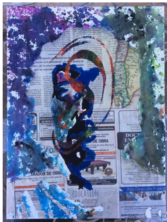
Figura 7. Obra propia de "Autorepresentación" (2014). Técnica mixta sobre tela. 30 x 40 cm. Imagen propia bajo licencia CC BY-NC-ND 4.0