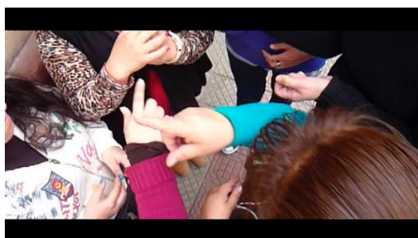
Figura 12. Captura de "Conversación en silencio" (2015). 11:29 min. Sonido de 2º mov. de la Sinfonía nº 9 de Beethoven. Videoarte (HD). Imagen propia bajo licencia CC BY-NC-ND 4.0

Sin embargo, estas visiones diferentes pueden ser uno de los principales obstáculos y dificultades a la hora de ejercer la profesión o desarrollar actividades de producción artística. Existen varias razones que generan una mayor desigualdad basada en la discriminación y el desarrollo humano insuficiente de personas en situación de discapacidad.