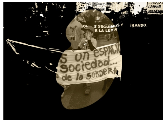
Figura 4. Obra propia de "Sin educación artística inclusiva... estamos muertos IVb" (2011). Arte digital.