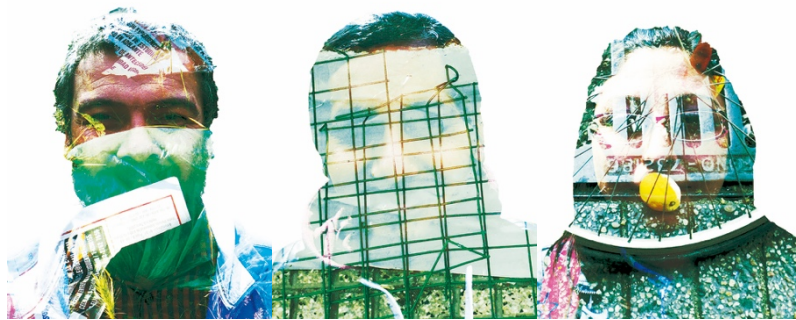
Figura 9. Obras propias de "Retrato ambiental" (2015). Fotomontaje digital en impresión lambda y foam. 52 x 70 cm. (por cada obra). Imágenes propias bajo licencia CC BY-NC-ND 4.0

En este sentido más estricto sobre el cuestionamiento del arte y la cultura inclusiva, no se reconoce la existencia de lo estético más allá de lo artístico en todas esferas de la actividad social, donde la participación activa ha incorporado sus preocupaciones esenciales. Por ejemplo, cabe mencionar al artista chino, Ai Weiwei (1957), es uno de los artistas más influyentes a nivel mundial contra el poder del régimen comunista en China, así como el «artista democracia» por la lucha por la libertad de expresión. No hay compromiso que el artista y sus obras adquieren cuando se da cuenta de que el arte es una herramienta para la transformación social.