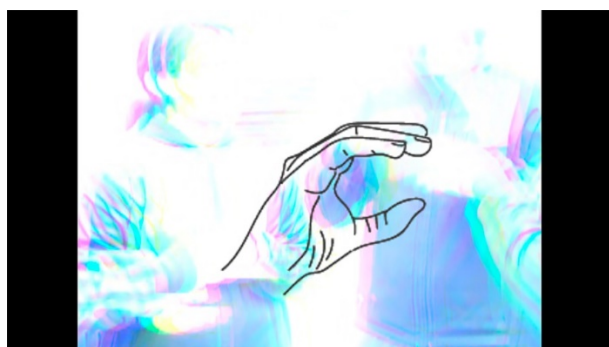
Figura 10. Captura de "Código de señas" (2015). 1:48 min. Videoarte (DV). Imagen propia bajo licencia CC BY-NC-ND 4.0

La pregunta es: ¿Crees que el arte social sigue siendo un lenguaje artístico que podrá cambiar la mentalidad 1 del artista en situación de discapacidad auditiva? El videoarte puede ser un medio interesante de expresión en este sentido (Figuras 10 a 12). El propio uso de la lengua de señas/signos es un sinónimo del código gestual para personas Sordas. Como concepto de código no lingüístico, no necesita una comunicación verbal, es decir, no requiere de un idioma determinado (comunicación verbal, así como el código verbal o semiología), que será capaz de transmitir el mensaje. Para este código gestual será útil que, tanto el emisor como el receptor, sepan su significado visualmente, sin necesidad de tener conocimiento de la lectura y la escritura. Se debe reconocer este código gestual al usar su propio idioma de la lengua de señas chilena 2 . En este sentido, no se trata de la identidad social de las personas sordas, ni de las organizaciones e instituciones para las personas Sordas, sino de ver sus problemáticas la estar involucrados en la estructura social de las comunidades educativas, artísticas y culturales. Las personas sordas que viven una situación de sus barreras comunicacionales en diferentes espacios de formación profesional. Esto nos obliga a reflexionar en las barreras que impiden una comunicación a través del bilingüismo 3 en el campo artístico y educativo (Bernaschina, 2018, p. 49).