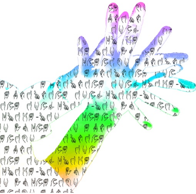
Figura 5. Obra propia de "Sin educación artística inclusiva... estamos muertos I" (2011). Arte digital. Imagen propia bajo licencia CC BY-NC-ND 4.0

Sin educación artística inclusiva... estamos muertos.