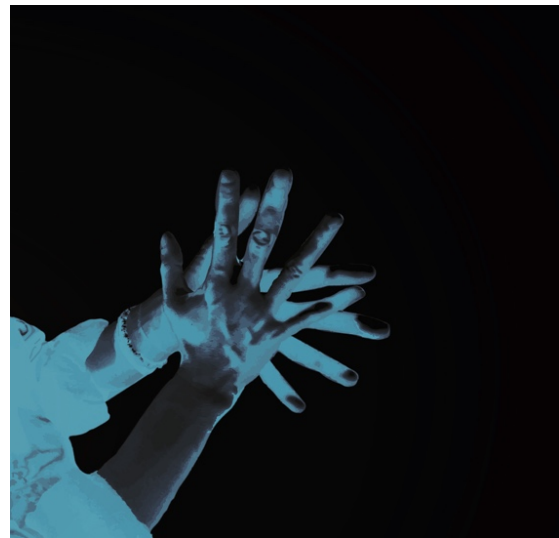
Figura 6. Obra propia de "Sin educación artística inclusiva... estamos muertos V" (2011). Arte digital. Imagen propia bajo licencia CC BY-NC-ND 4.0.