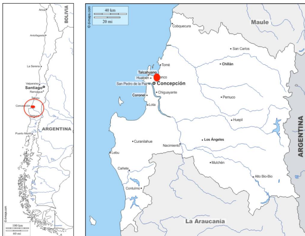
Figura 2. Principales lugares afectados por el terremoto de 1657. 39

Dossier Terremotos, historia y sociedad en Hispanoamérica