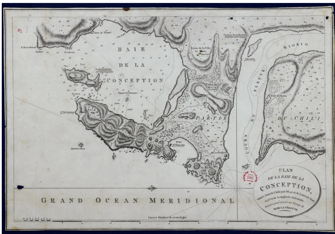
Figura 1. Bahía de Concepción, 1797. 25

Dossier Terremotos, historia y sociedad en Hispanoamérica