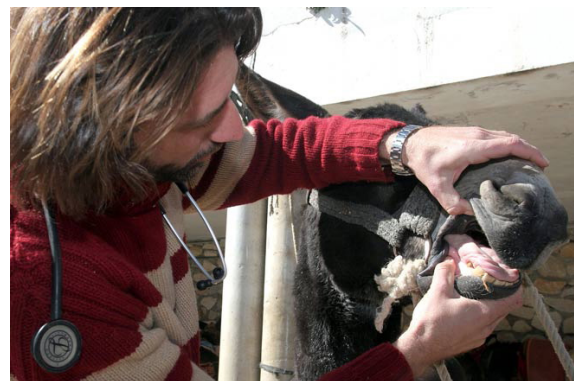
Veterinario examinando burros-taxi.