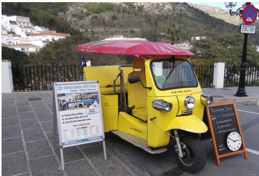
Tuk-tuk Spain “Panoramic City Tour”.