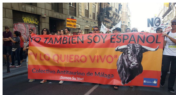
Foto 3: Concentración animalista anti-servicio burros-taxi. Abajo: Imagen origen de última polémica. Dcha.: Iconografía de manifestación del Colectivo Antitaurino en Málaga.