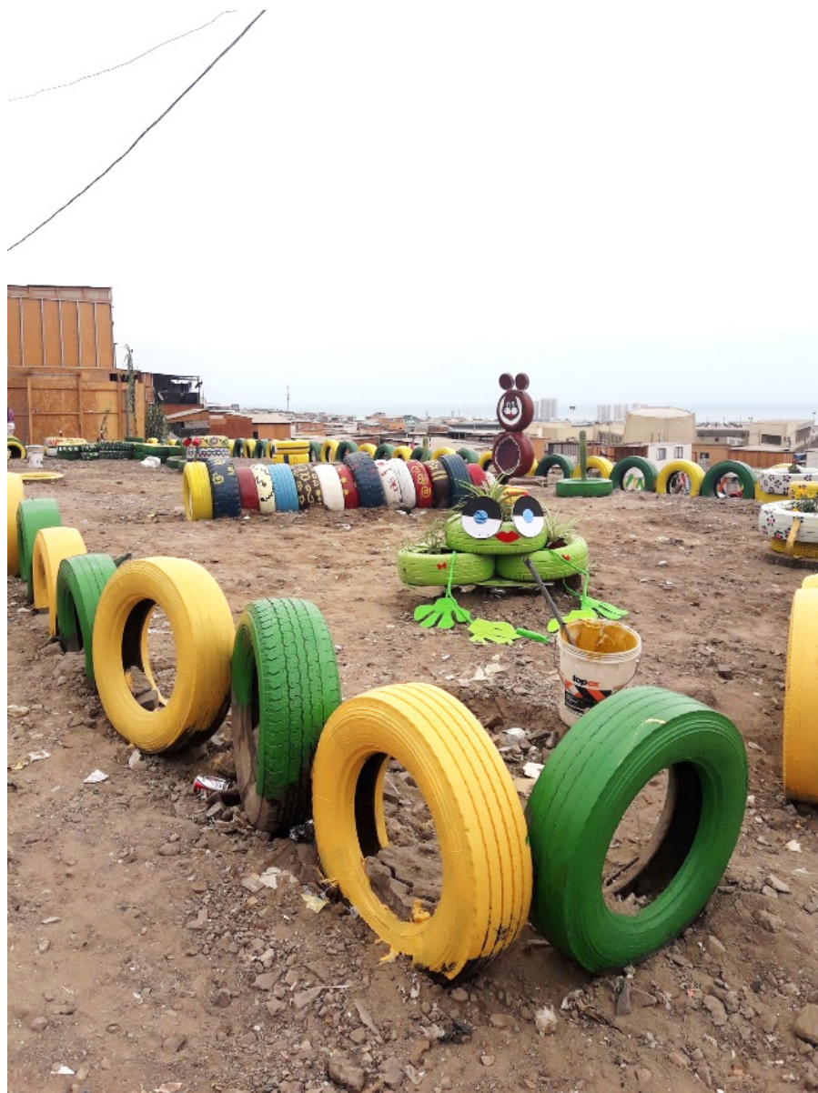
Figure 6: Parc de jeux pour enfants fabriqué par les habitants de Los Arenales.

l'accent sur la nécessité, pour avancer vers une ville plus inclusive, de ne plus considérer la satisfaction des soins comme relevant de la sphère domestique, mais de les prendre pleinement en considération au moment de planifier la ville (Montoya, 2012). En ce sens, le campamento est fait d'expériences embryonnaires pour penser en pratique ces injonctions à construire, selon l'expression de la sociologue Blanca Valdivia une " ciudad cuidadora ", "une ville qui soigne" (Valdivia, 2018).