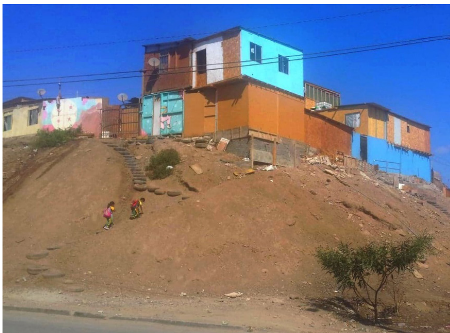
Figure 1: Depuis la rue formelle, vue du campamento Los Arenales.

“A Antofagasta, si tu es migrant, tu ne peux pas tomber malade, sinon tu ne peux plus payer ton loyer, tu ne peux plus manger.” Entendu à plusieurs reprises dans les récits des travailleurs immigrés, ce commentaire illustre bien l’histoire de Verónica. Quarantenaire, elle travaille comme garde d’enfants chez des particuliers et vit à Antofagasta depuis dix ans. Elle est originaire de Cochabamba, en Bolivie, où ses filles, de 19 et 21 ans, vivent encore et font leurs études. Depuis qu’elle a émigré, Verónica n’a cessé de leur envoyer une part impor-