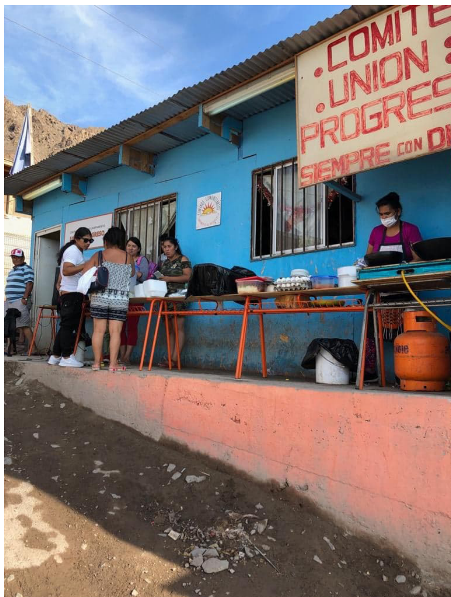
Figure 3: Plato único organisé dans le campamento Balmaceda, 27 janvier 2019.