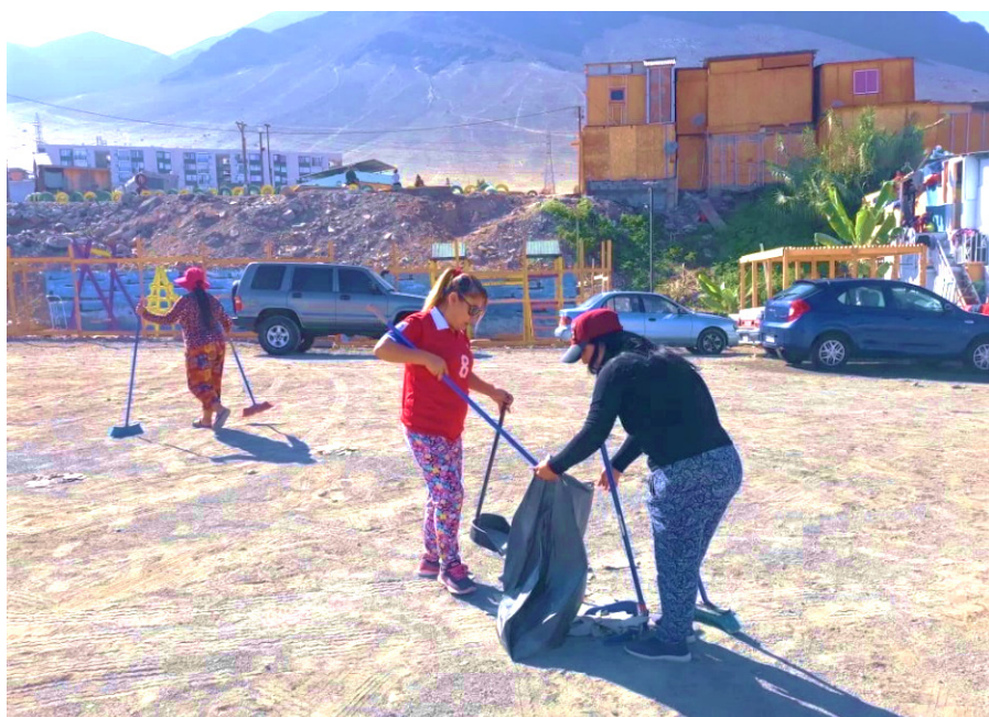
Figure 2: Deux habitantes participant à une tâche de nettoyage collectif du campamento Los Arenales. Avril 2019.

munautaire des campamentos d'une existence légale et d'une structure formelle, fondée sur la prise de décision démocratique au cours d'assemblées. Au lieu d'y évaluer l'avancement de chaque famille pour réunir l'épargne demandée et d'élaborer un "projet de logement" dans l'attente d'une allocation étatique, le comité devient l'instance au sein de laquelle les habitants se concertent pour aménager le territoire, en assurer la sécurité, organiser les événements communautaires. Le statut légal du comité exige que le président, le secrétaire, le trésorier et le vice-président soient élus démocratiquement. La direction qu'ils constituent est souvent presque exclusivement féminine.