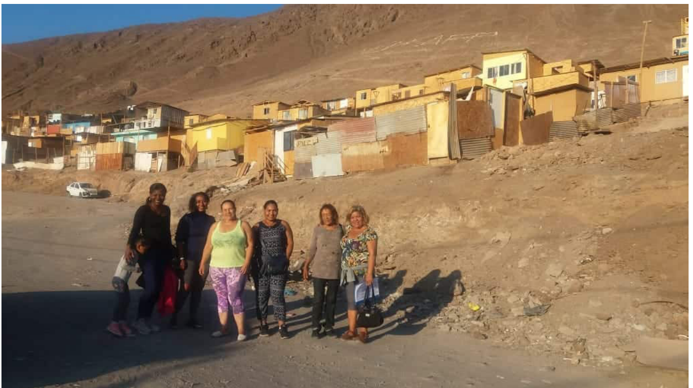
Figure 8: Groupe de femmes immigrées du campamento Los Arenales engagées dans la vie communautaire, devant le campamento.