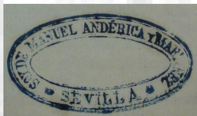
Sello exlibris con el lema: «Soy de Manuel Andérica y Martínez. Sevilla».

Finalmente, al margen de las procedencias hereditarias ya señaladas, no ha sido posible determinar ningún otro origen en la formación de la biblioteca de Manuel Andérica. El bibliófilo tampoco era muy dado a escribir o a anotar en sus libros, más allá del exlibris manuscrito (cuando no impreso) que estampaba siempre en la portada.