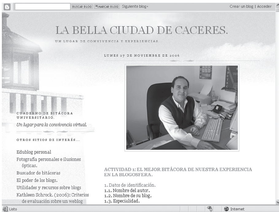
Figura 2: Página inicial del edublog de la experiencia didáctica.

Como puede comprobarse en la figura 2 en el edublog se diferencian tres partes principales: un título La bella ciudad de Cáceres ; el lateral (frame) izquierdo constituido por un listado de vínculos relevantes, algunos de los cuales hacen referencia a edublog construidos por los propios estudiantes y un perfil del blogger junto a una serie de etiquetas que dividen de forma cronológica los cerca de 250 comentarios y una zona denominada álbum de fotos para crear un espacio afectivo y empático. El espacio central estaba destinado para el envío de comentarios y posibles actividades.