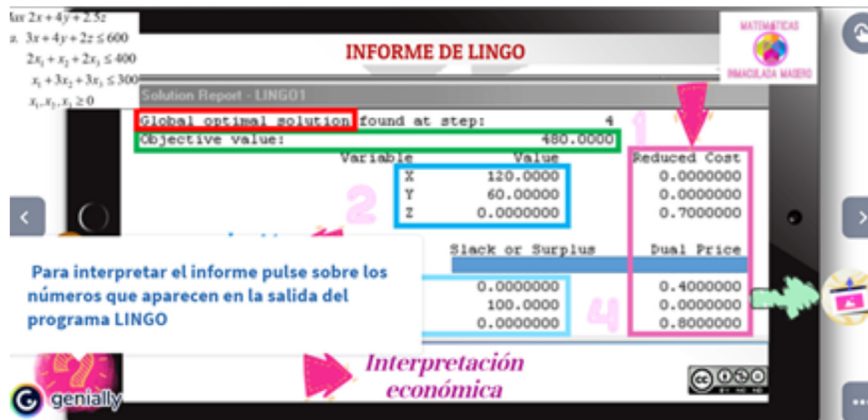
Figura 3. Pantalla 6 del MDD con detalle desplegado al pasar el ratón sobre el símbolo de interrogación.