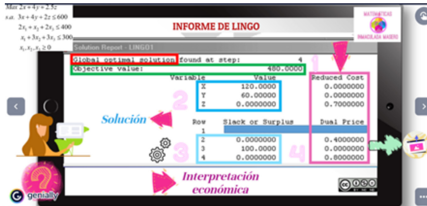
Figura 3. Pantalla 6 del MDD.

guiar al estudiante en la presentación de forma motivadora (Figura 2 y Figura 3). En el diseño también se han incluido elementos creativos y animados que estimulen y hagan más atractivo el MDD para el estudiante, lo que revierte en el aprendizaje al alumnado. El avance y retroceso entre pantallas permite la navegación en el MDD. La transición de una pantalla a otra se realiza sobre un fondo de madera que simula una mesa de estudio.