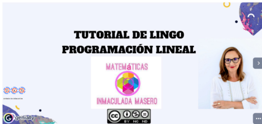
Figura 2. Portada del MDD.

En la primera pantalla está el título (claro y acorde al contenido), la autora y un contador de visitas (Figura 2).