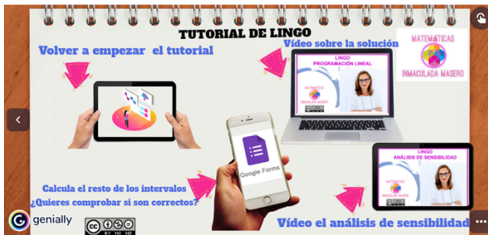
Figura 3. Pantalla 10.

Por último, se incluye una pantalla con acceso a otros recursos (Figura 4). En este caso, los elementos se han situado dentro de un cuaderno sobre una mesa de madera.