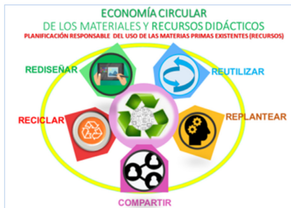
Figura 1. Economía circular de los materiales y recursos didácticos.

Este proceso se completa incluyendo como principio compartir los materiales didácticos para que puedan ser utilizados por otros y otras docentes.