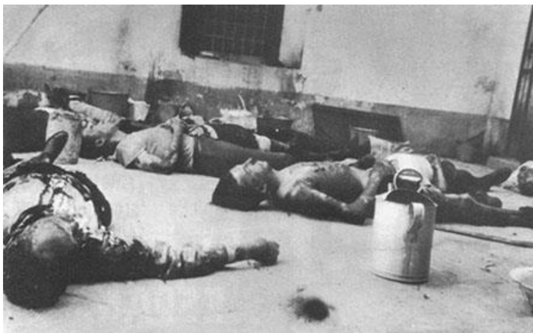
Ilustración 1 – Quemados en la cárcel del Ayuntamiento de Arahal.