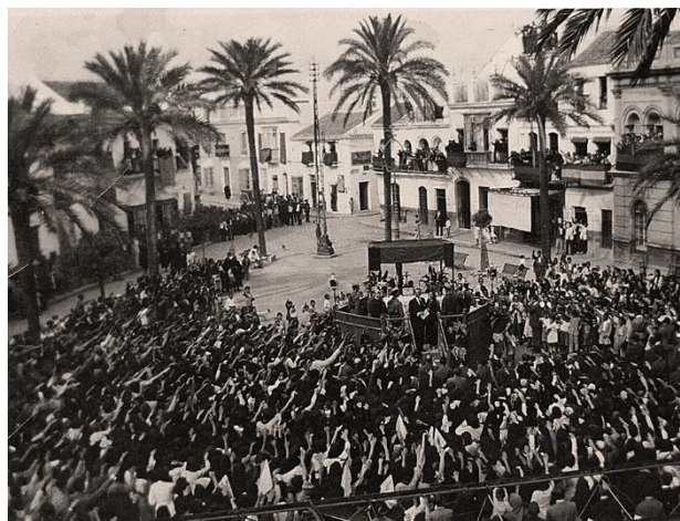
Ilustración 3 - Misa durante la Guerra Civil en acción de gracia por la toma de alguna ciudad.

“No es difícil apuntar que la represión, en una evaluación prudente, podría haberse situado entre quinientos y seiscientos vecinos. Quizá alguna investigación en el futuro nos pueda proporcionar una cifra más aproximada, más allá de los datos que se han podido recopilar en este trabajo.” (García J.M., 2016, p.161)