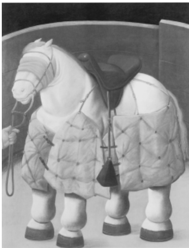
Fig. n.º 18.– Botero, F.: Caballo del picador , 1986, ól. s/t, 172 x 132 cm (Col. del artista).

portar los cestos de lana. Diego Velázquez de Cuéllar, el que había de ser Velázquez , sin necesidad de patronímico alguno, comienza como debe ser, moliendo los colores en el taller de Pacheco (por cierto, que esa «cocina» hace que sus lienzos tengan una gran calidad técnica y parezcan nuevos a pesar de los siglos que han pasado por ellos).