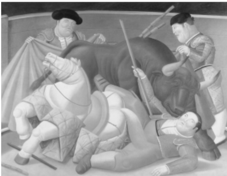
Fig. n.º 19.– Botero, F.: El quite , 1988, ól. s/t, 209 x 291 cm (Col. del artista).

to: pero hay que alumbrársela y ahormársela. ¿Fue Miguel Angel quien dijo que una escultura es lo que queda después de quitar al bloque de piedra lo que le sobra? Pues, en el caso del toro bravo, una embestida adecuada es lo que resulta des-