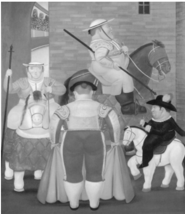
Fig. n.º 21.– Botero, F.: Patio de caballos , 1984, ól. s/t, 194,2 x 128,4 cm (Col. del artista).

«¡Cómo voláis al socorro en el quite tendiendo las alas del ángel!»