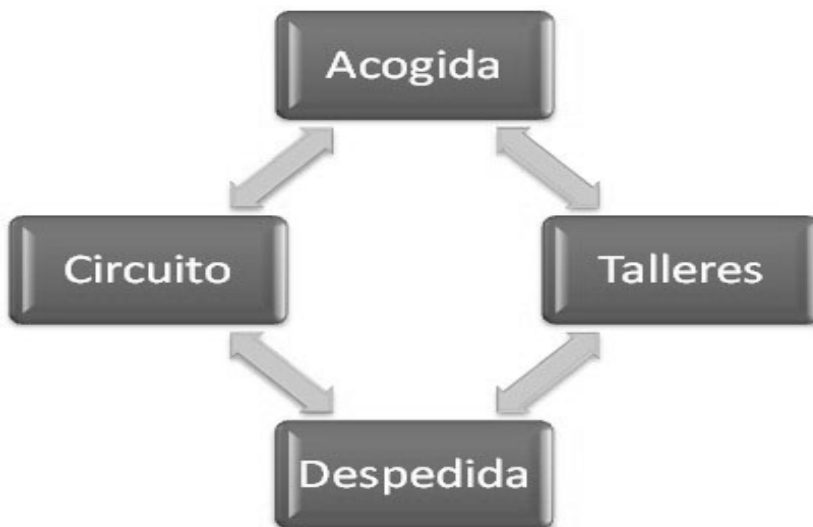
Figura 3. Fases de la propuesta educativa. Elaboración propia.

A su vez, cada equipo de trabajo se dividió en 6 equipos para las visitas y en 6 equipos para