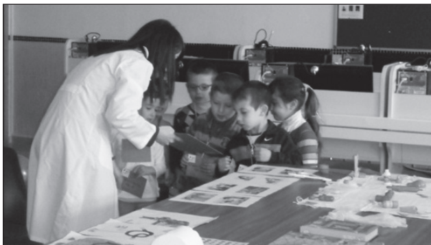
Imagen 3. Actividades del circuito.