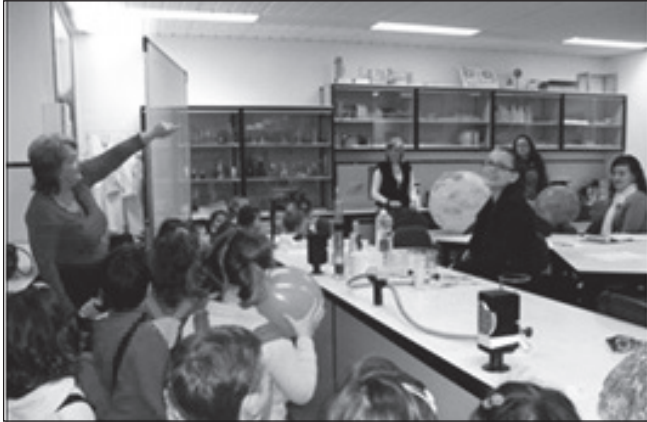
Imagen 1. Visita al laboratorio.