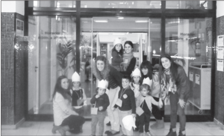
Imagen 2. Bienvenida a los niños/as 3 y 4 años.