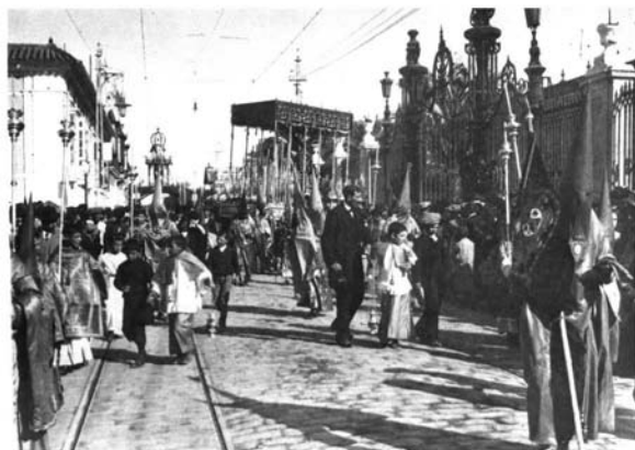
Vista de la calle San Fernando en 1918. Detalle de la crestería de la verja de la Fábrica de Tabacos.