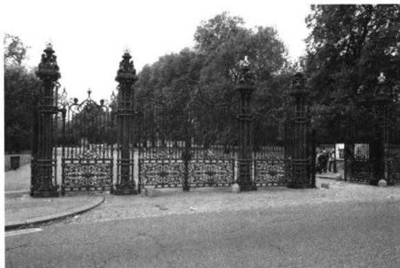
Verja en Kensington Garden-Londres.