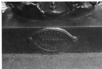
Detalles de la verja de Kensington Garden