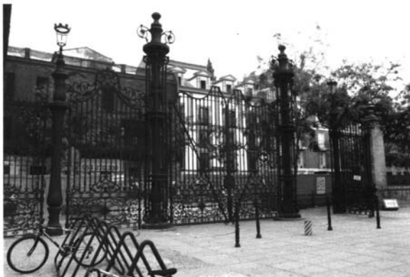
Verja de la Fábrica de Tabacos

Este murallón, construido en el último cuarto del siglo XVIII para sustituir el paño de la muralla que cerraba la ciudad por esta parte, es el que en su lugar va a dejar sitio para colocar la verja de hierro fundido que actualmente cierra la fábrica a lo largo de la calle de San Fernando y que es el objeto de este estudio.