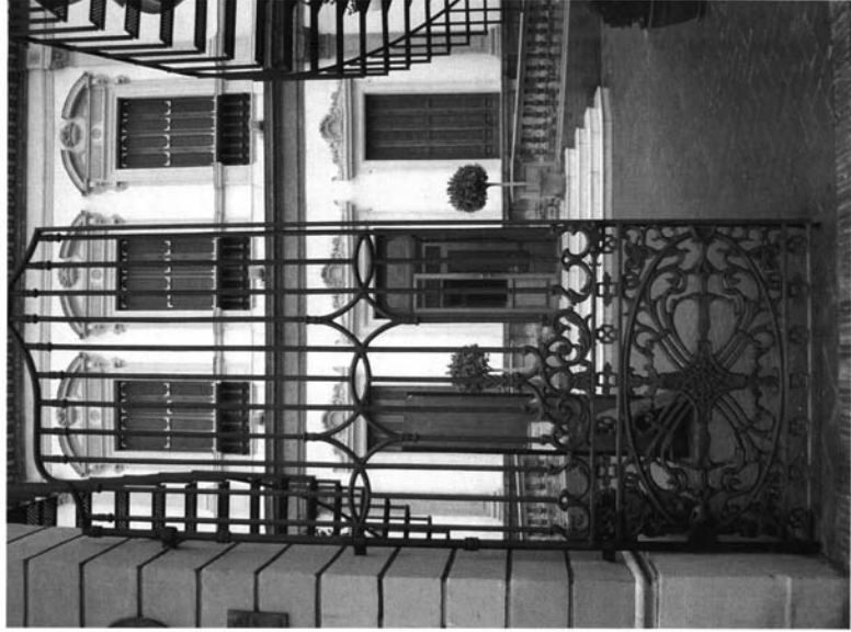
Verja de la Casa de Las Sirenas en la Alameda de Hércules.