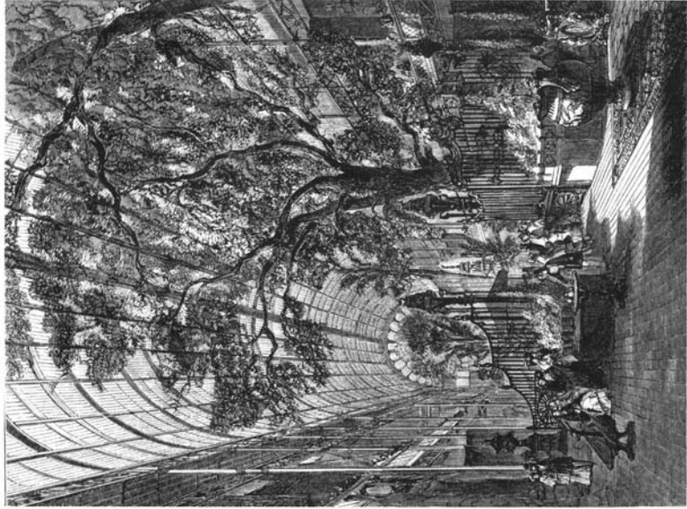
Grabado del Pabellón del Palacio de Cristal, 1851