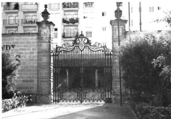
Reja de las Bodegas del Conde de los Andes en Jerez de la Frontera.