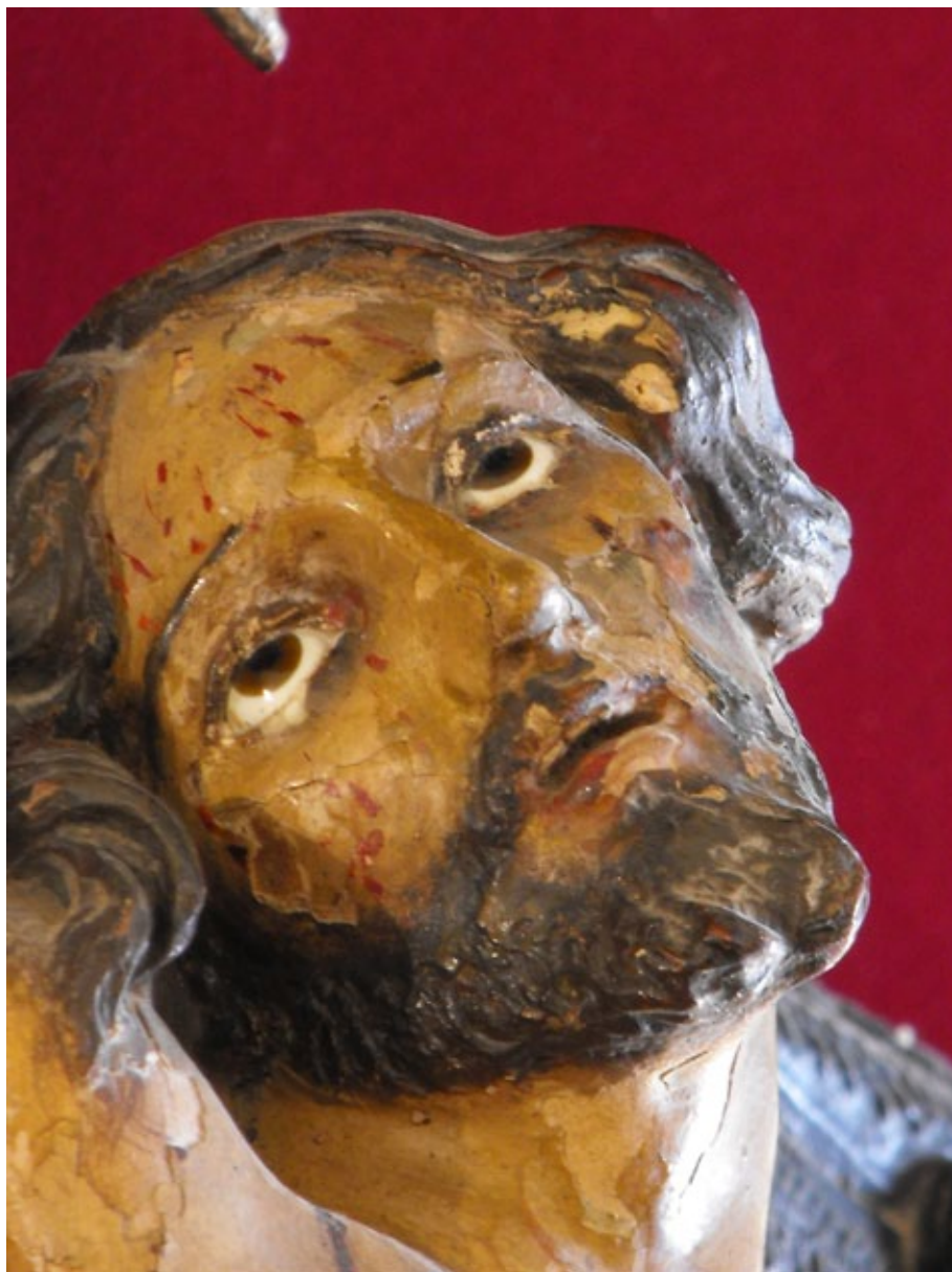
Fig. 5. Detalle del rostro del Crucificado atribuido a José de Arce. Ermita de las Angustias de Jerez de la Frontera.