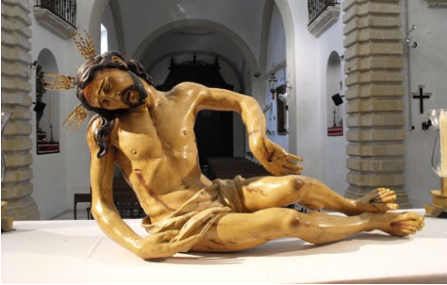
Fig. 6. Cristo muerto. José de Arce. Ermita de las Angustias de Jerez de la Frontera.