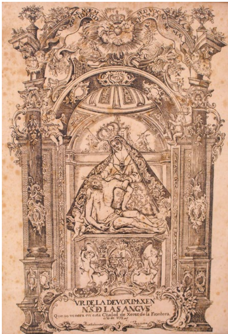
Fig. 8. Nuestra Señora de las Angustias. Buril anónimo. 1778. Ermita de las Angustias de Jerez de la Frontera.