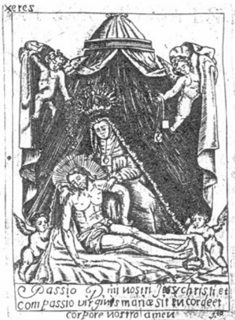
Fig. 7. Xilografía anónima de Nuestra Señora de las Angustias. Ermita de las Angustias.