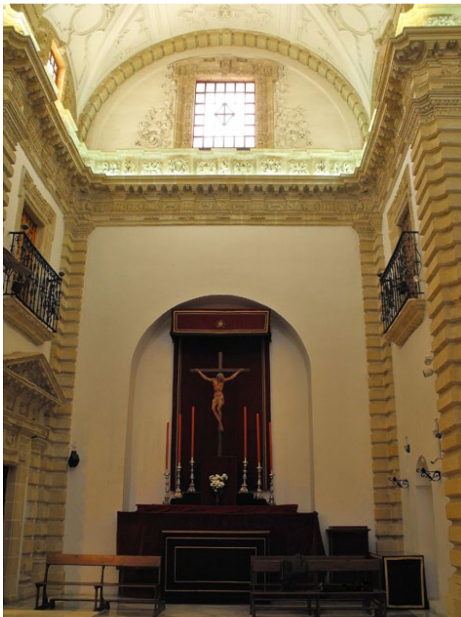
Fig. 3. Crucero, brazo de la epístola. Ermita de las Angustias de Jerez de la Frontera.