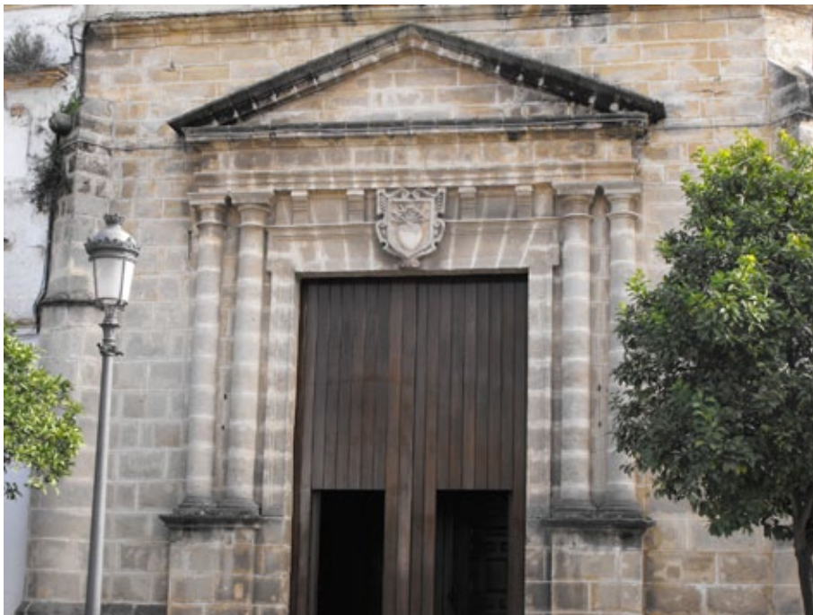
Fig. 1. Fachada. Diego Moreno Meléndez. Ermita de las Angustias de Jerez de la Frontera. Ermita de las Angustias.