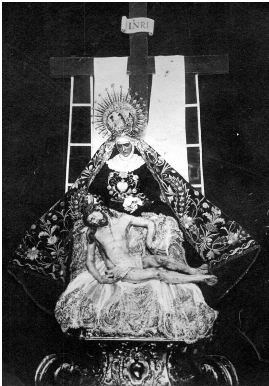
Fig. 9. Nuestra Señora de las Angustias. Ermita de las Angustias de Jerez de la Frontera.