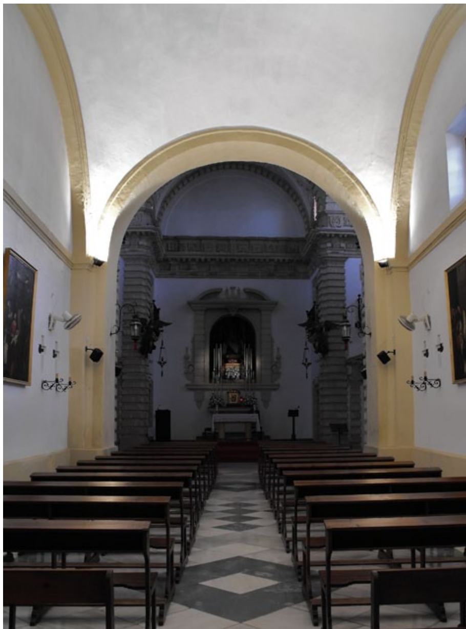
Fig. 2. Bóvedas de Diego Martín de Oli. Ermita de las Angustias de Jerez de la Frontera.