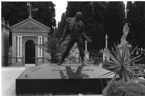
7.- Víctor Ochoa. Tumba de Paquirri . Cementerio de San Fernando. Sevilla.