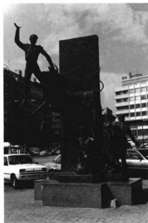
8.- Luis Sanguino. Monumento al Yoyo . Plaza de las Ventas. Madrid.