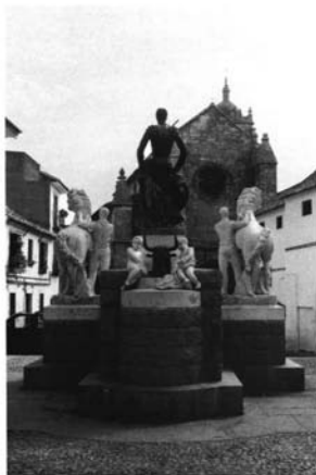
5.- Manuel Álvarez Laviada. Monumento a Manolete . Plaza del Conde de Priego. Córdoba.