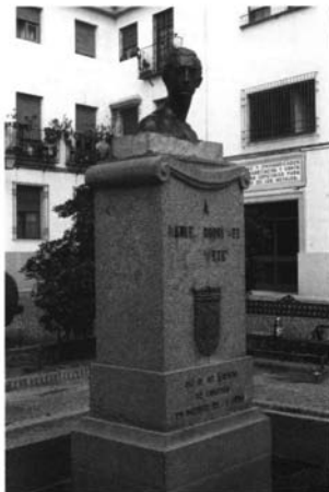
3.- Juan de Ávalos. Monumento a Manolete . Plaza de la Lagunilla. Córdoba.