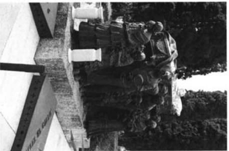
1.- Mariano Benlliure. Tumba de Joselito . Cementerio de San Fernando. Sevilla.