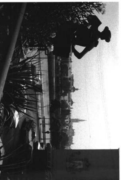
2.- Venancio Blanco. Monumento a Juan Belmonte . Sevilla.