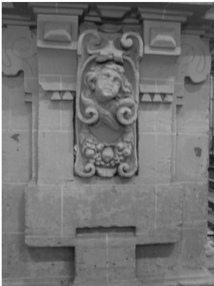
Figura 5. Antón Martín Calafate y ¿Luis Salgado? Detalle del basamento de una pilastra en la nave central.