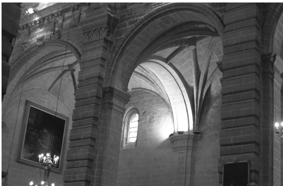
Figura 3. Antón Martín Calafate: Iglesia Prioral del Puerto de Santa María. Pilastras de la nave central y cubiertas de la nave del Evangelio hacia los pies.