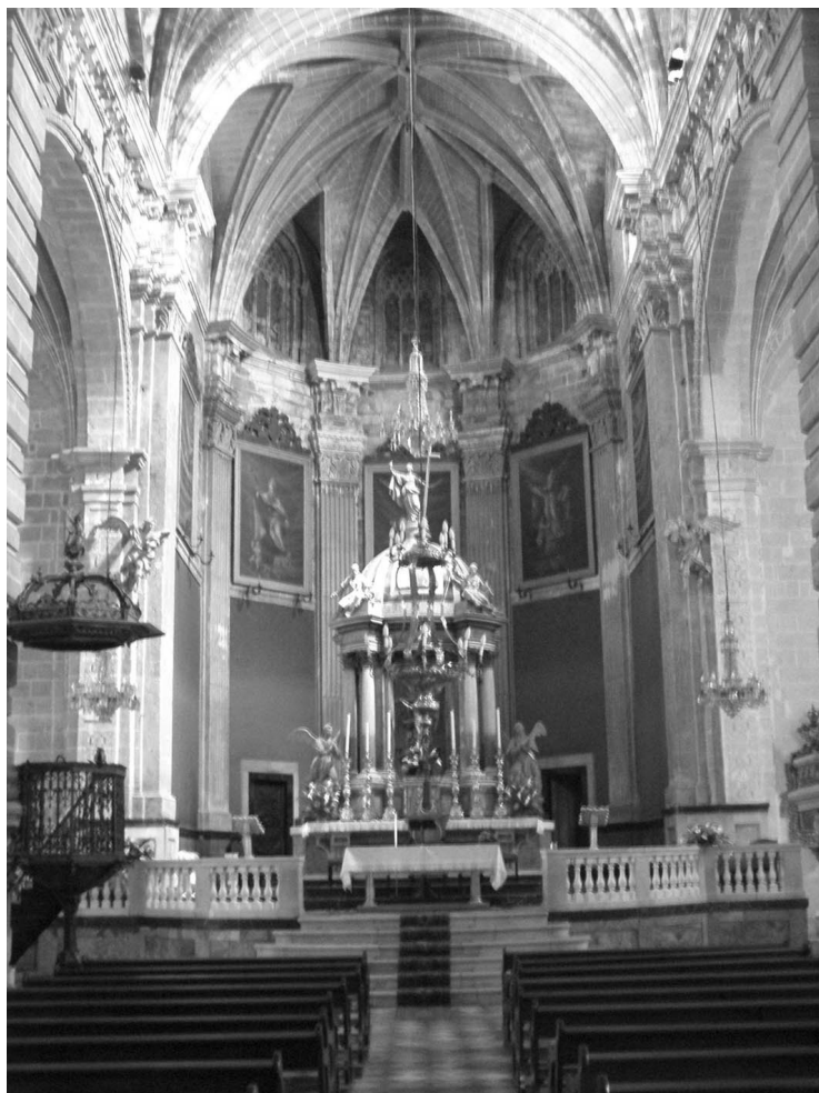
Figura 1. Antón Martín Calafate: Iglesia Prioral del Puerto de Santa María. Presbiterio.