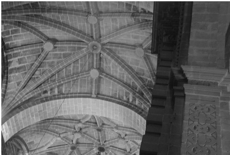
Figura 2. Antón Martín Calafate: Iglesia Prioral del Puerto de Santa María. Cerramiento de la nave central.