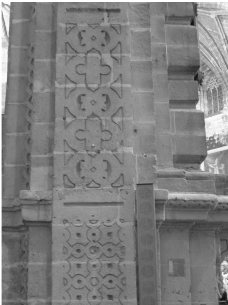
Figura 6. Antón Martín Calafate: Iglesia Prioral del Puerto de Santa María. Detalle de las pilastras en la nave del Evangelio.