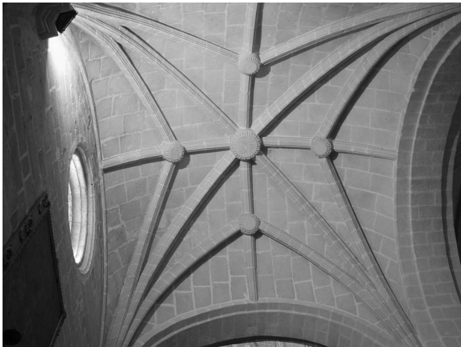
Figura 7. Antón Martín Calafate: Iglesia Prioral del Puerto de Santa María. Bóveda de la nave de la Epistola con la fecha 1662 en la clave de la izquierda.