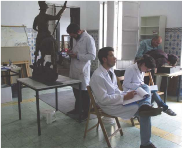
Figura 7. Los alumnos son entrenados en la documentación y examen técnico de las obras antes de su intervención.

Cuatro pinturas sobre lienzo y cuatro esculturas (dos en barro cocido y policromado y dos tallas en madera estofada) contando con los proyectos, seguimientos de intervención y tutorización de nuestros profesionales especialistas en pintura y escultura.