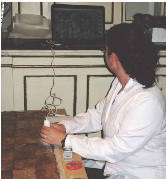
Figura 8. Empleo de la lupa digital con puerto usb para el estudio de ligamentos del lienzo intervenido: "Adoración de los Pastores".

Los alumnos participaron de cada fase de trabajo (Figura 7). Como complemento al análisis organoléptico, el examen se completó con la aplicación de otras tecnologías científicas como radiación de luz ultravioleta, radiografía, etc. (Figuras 8 a 11).