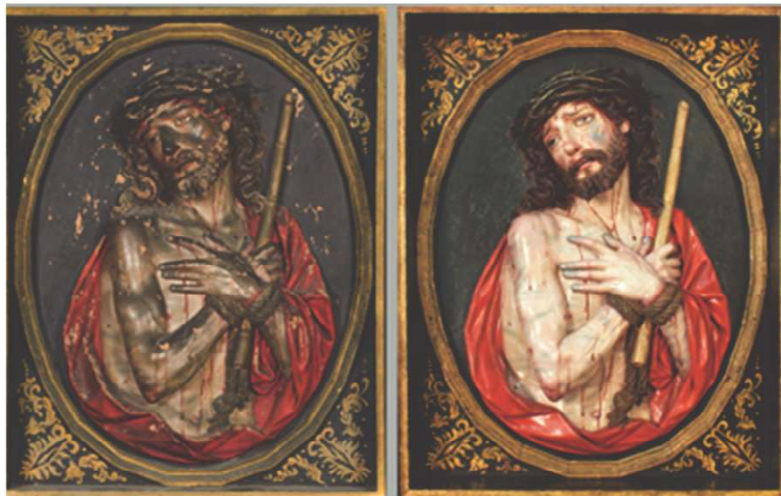
Figura 16. Vistas generales del relieve del "Ecce Homo", antes y después del tratamiento.