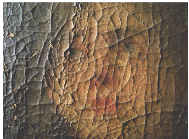
Figura 10. Detalle con luz rasante del rostro de la Virgen en el cuadro "Adoración de los Pastores".