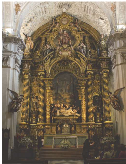
Figura 1. Vista general del retablo mayor de la Iglesia del Hospital de la Santa Caridad de Sevilla.

El Hospital de la Santa Caridad 2 constituye un escenario extraordinariamente rico y variado en tipología de bienes para albergar este proyecto pionero, lo que ha sido posible ante todo gracias a la confianza de su Cabildo de Hermandad, responsable de su tutela. Este enclave (Figura 1) se ha convertido en un contexto real de investigación para el equipo universitario que pretende marcar nuevas estrategias y fomentar la transmisión de sus resultados, y en un laboratorio donde experimentar nuevas metodologías formativas para el alumnado, fuera del espacio del aula.