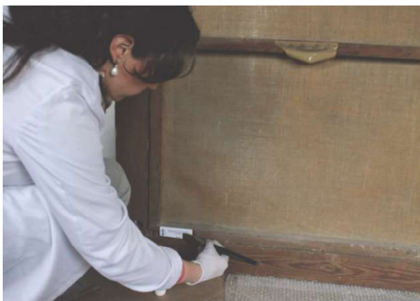
Figura 5. Fase de signado de la pinacoteca.