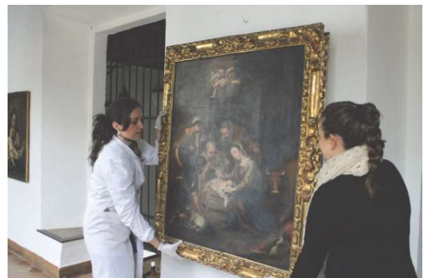
Figura 3. Manipulación y traslado de cuadros.

La metodología de trabajo desarrollada en esta fase se dividió a su vez en varias actuaciones para una ejecución paralela y los alumnos colaboraron en el reconocimiento de los espacios que albergan las colecciones, analizando las obras para su documentación, tomando como punto de partida el antiguo catalogo publicado (Valdivieso y Serrera: 1980).