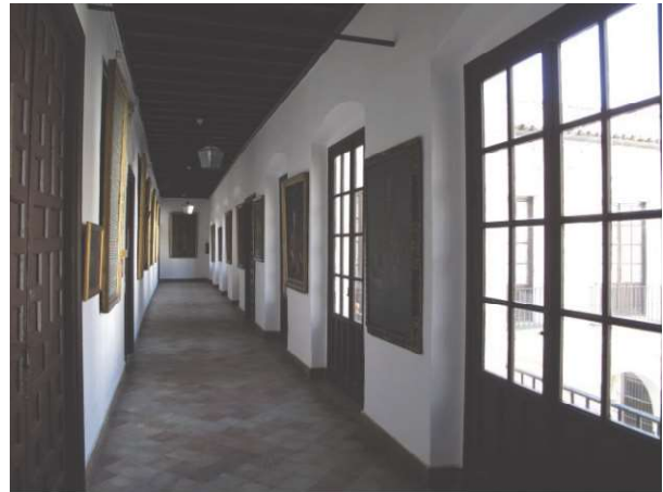
Figura 6. Estudio del contexto para evaluación de riesgos u estrategias de mejora (Galería Alta)