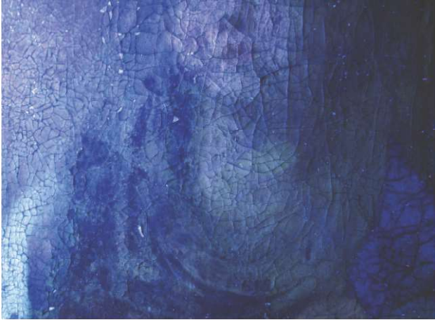
Figura 11. Fotografía con luz ultravioleta de la imagen de la Virgen en el cuadro "Adoración de los Pastores".