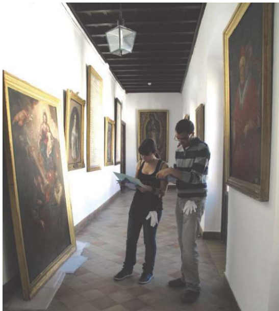
Figura 4. Examen técnico individualizado de los cuadros de la colección.

Una de las tareas esenciales es el diseño de distintas herramientas básicas para el control de los bienes, que normalizan la toma y registro de datos y sirve a su vez de método de estudio al alumno: