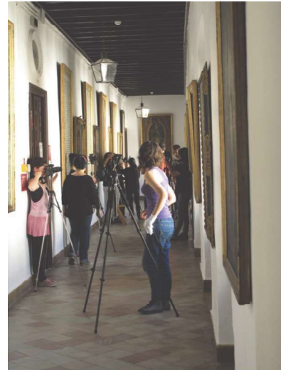
Figura 2. Actividad formativa en técnicas fotográficas aplicadas a la reproducción de pinturas.

esfuerzos sobre todo en la pinacoteca, por el elevado número de obras que la conforman y de dependencias en las que se encuentra dispersa.