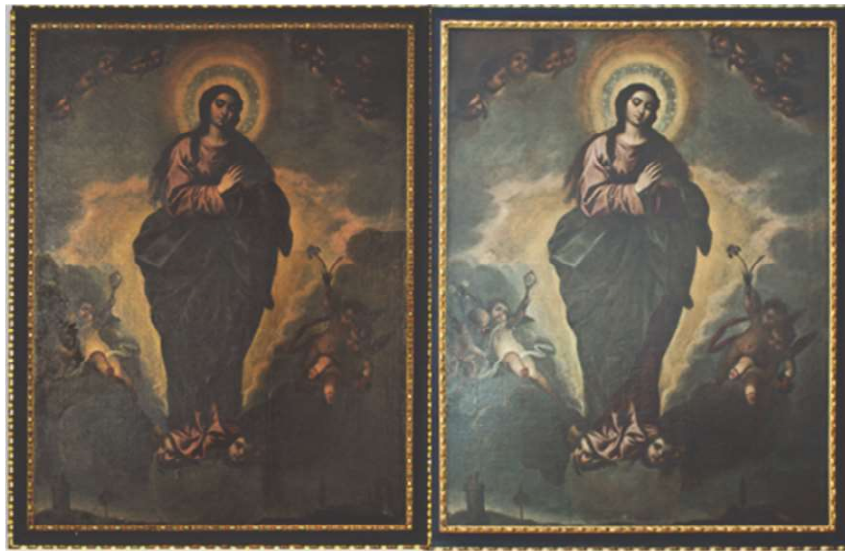
Figura 15. Vistas generales del lienzo de la "Inmaculada Concepción", antes y después del tratamiento.