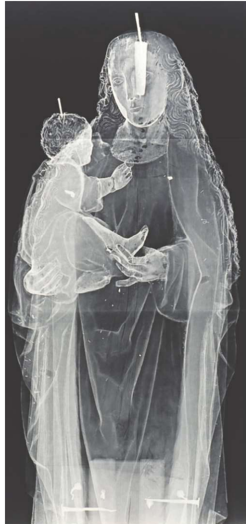
Figura 9. Radiografía de la talla "Virgen de la Caridad".