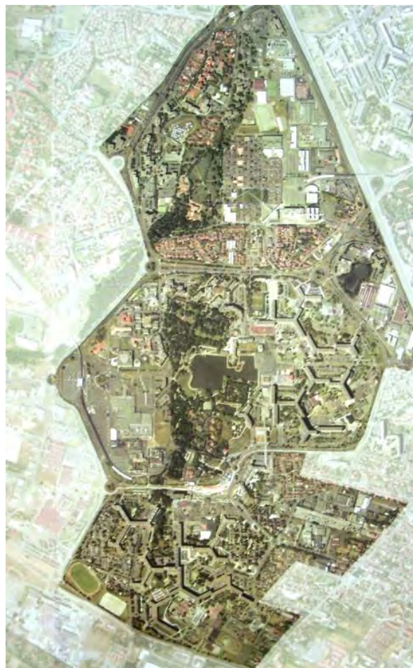
Figura 8. Toulouse le Mirail: Bellefontaine, Reynerie, Mirail; vista aérea de la estructura urbana antes del GPV, 2002.

Toulouse le Mirail había comenzado a transformarse en un ghetto de la ciudad, y especialmente su barrio central de Reynerie. Su integración en el tejido residencial de Toulouse será cada vez más difícil y compleja, y el gran barrio irá formando parte, poco a poco, de la denominada banlieue 10 . La cit  satellite original construida por Candilis-Josic-Woods se había transformado lentamente en un “barrio dormitorio”, tras las décadas de barrio idílico, y estaba cada vez más aislado de la ciudad.