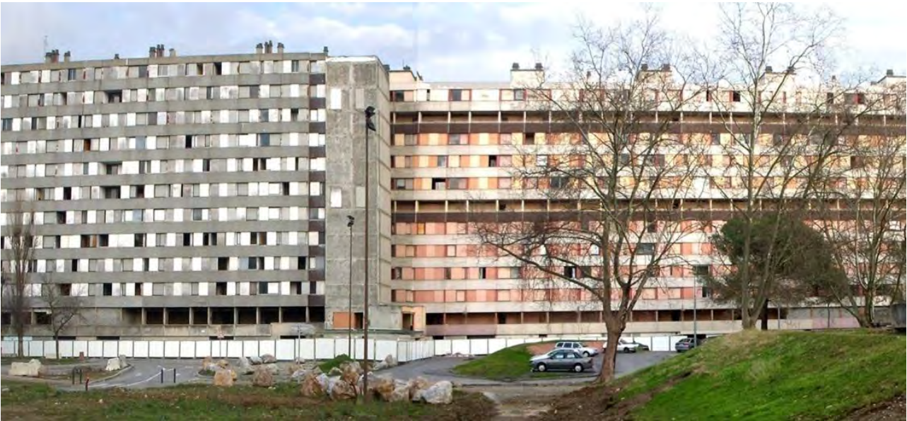
Figura 9. Bellefontaine, primera fase GPV: grandes bloques antes de ser demolidos, 2010.

Una línea general de operaciones de demolición-reconstrucción de viviendas aplicadas por los Grand Projet de Ville también en muchos grands ensembles en Francia, y donde se debe destacar inevitablemente un factor muy importante: la asociación directa de esta estrategia de demolición de viviendas con la búsqueda de reducción del número de habitantes y, con ello, de los problemas sociales existentes en la actualidad en las banlieues .