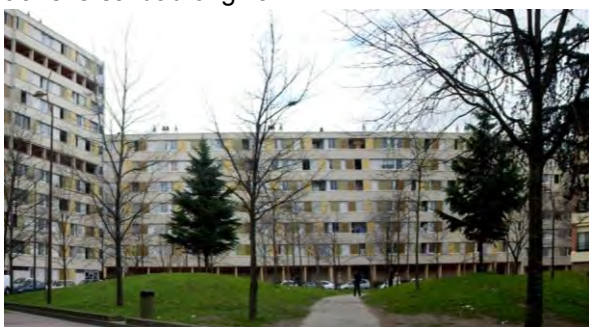
Figura 10: Bellefontaine, primera fase GPV: resultado de las operaciones de rehabilitación de los grandes bloques, 2011.

Las intervenciones de rehabilitación del GPV de Toulouse le Mirail en los grandes y pequeños bloques conservados (Figura 10), realizadas en Bellefontaine, se han concentrado en cambio principalmente en el aspecto exterior: se han renovado así los materiales de revestimiento del cerramiento exterior, acondicionándolos térmicamente, y los paneles de las correderas de las loggias ; y en los pórticos de las plantas bajas se han incorporado puerta de acceso en cada uno de los núcleos verticales, desapareciendo así la transversalidad original.