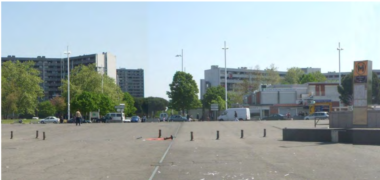
Figura 7. Reynerie, nueva centralidad tras la demolición de la “dalle”, estado nueva actual Plaza Abbal, 2011.