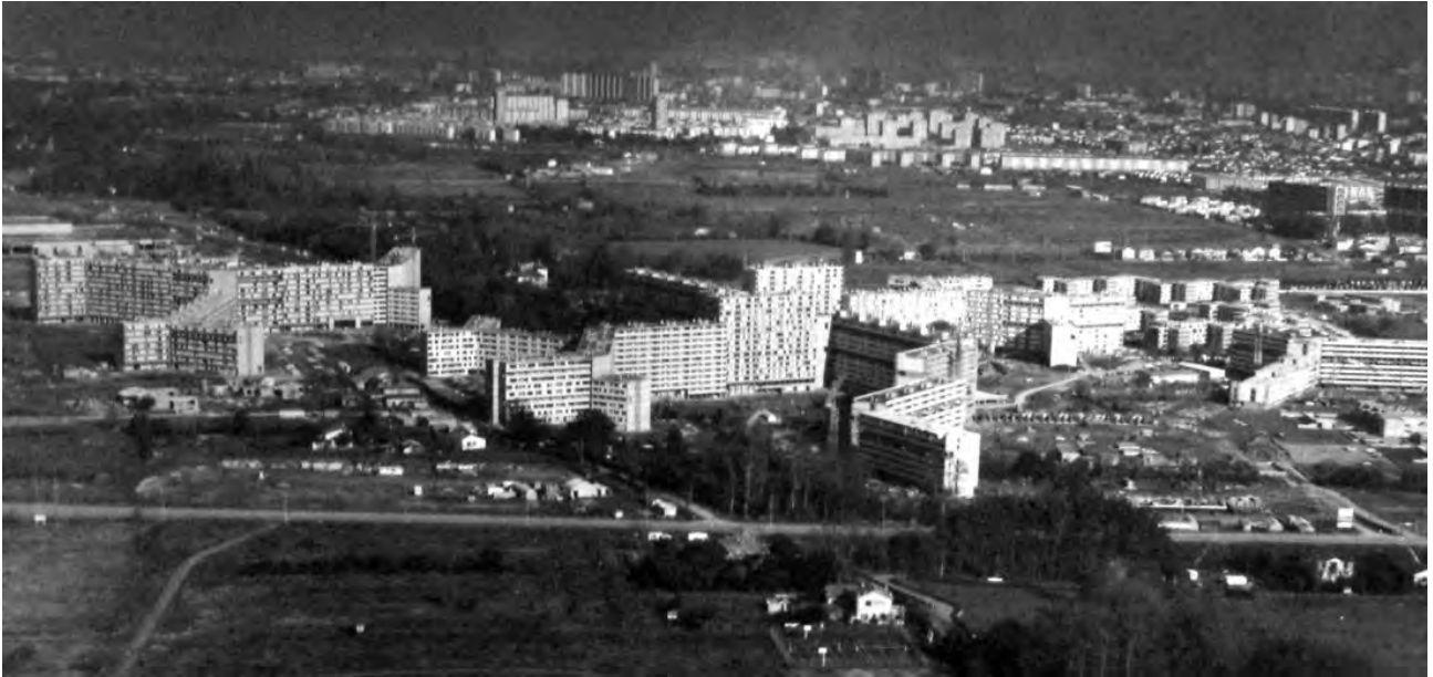
Figura 2. Bellefontaine, primera fase de ejecución, 1969.

A pesar de que esta primera fase de Toulouse le Mirail no fue completada, el resultado final del conjunto urbano conseguía trasladar el concepto arquitectónico propuesto por Candilis, Josic y Woods (Figura 2), principalmente a través de la estructura urbana generada por los grandes bloques (Figura 3), así como por la sección de la dalle que conectaba a los barrios. El conjunto