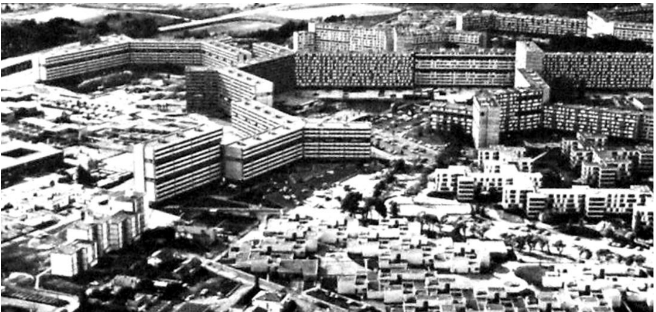
Figura 2. Bellefontaine, vista de los tres tipos de edificios residenciales, equipamientos y edificios docentes, sobre 1972.

reflejaba la construcción de un nuevo contexto, asociado a nuevos modos de habitar en la ciudad moderna, e incluía gran parte del programa previsto, tanto viviendas como equipamiento, permitiéndole así en el futuro funcionar de manera adecuada, y como un verdadero núcleo autónomo.