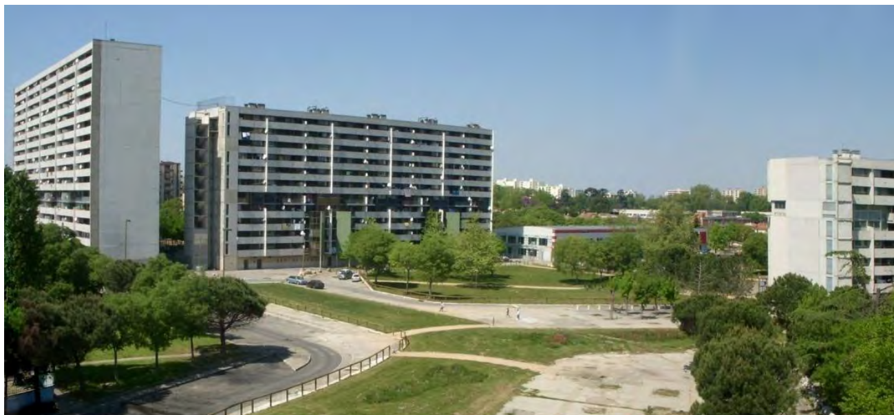
Figura 11. Reynerie, primera fase GPV: resultado de la demolición de grandes bloques y acondicionamiento del espacio público, 2011.