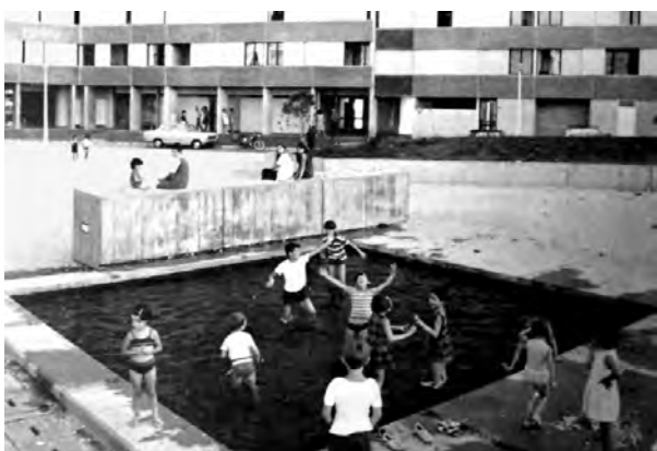
Figura 6. Bellefontaine, niños en uno de los espacios públicos entre los grandes bloques, sobre 1972.

Así, ante esta situación, un estudio sociológico realizado en Toulouse le Mirail en 1981 (AMT, 1981) revelaba algunos datos interesantes sobre su realidad social, y conseguía reflejar además el alto grado de satisfacción de los habitantes en el gran barrio, donde destacaban principalmente aspectos como la calidad espacial de las viviendas, la gran superficie de espacios públicos; y donde valoraban mucho también el funcionamiento de los edificios docentes y los equipamientos, y de los numerosos espacios públicos y de juego (Figura 6).