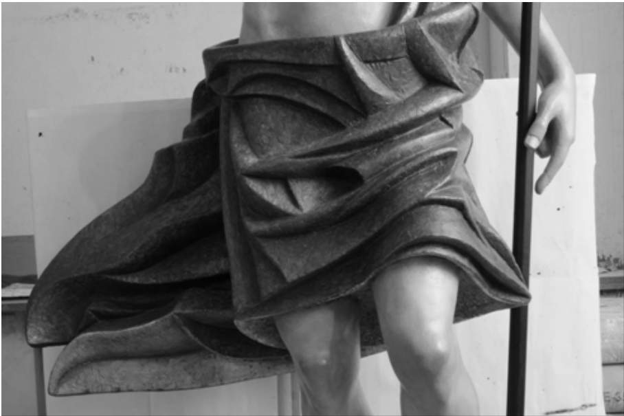
Fig. 11. Cristo Resucitado (Detalle)