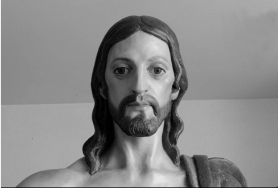
Fig. 10. Cristo Resucitado (Detalle)