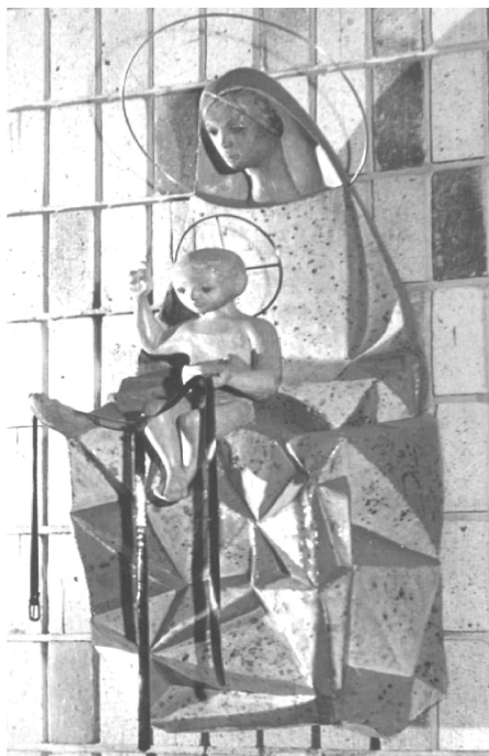
Fig. 1. Virgen con Niño. Obra de José Luis Sánchez. Templo de Santa Rita (Madrid) 1950

Esta evolución a lo largo del tiempo se ha hecho patente en manifestaciones plásticas muy diferentes; especial atención hemos de prestar a las que ocupan la segunda mitad del siglo XX tras la aparición de las vanguardias.