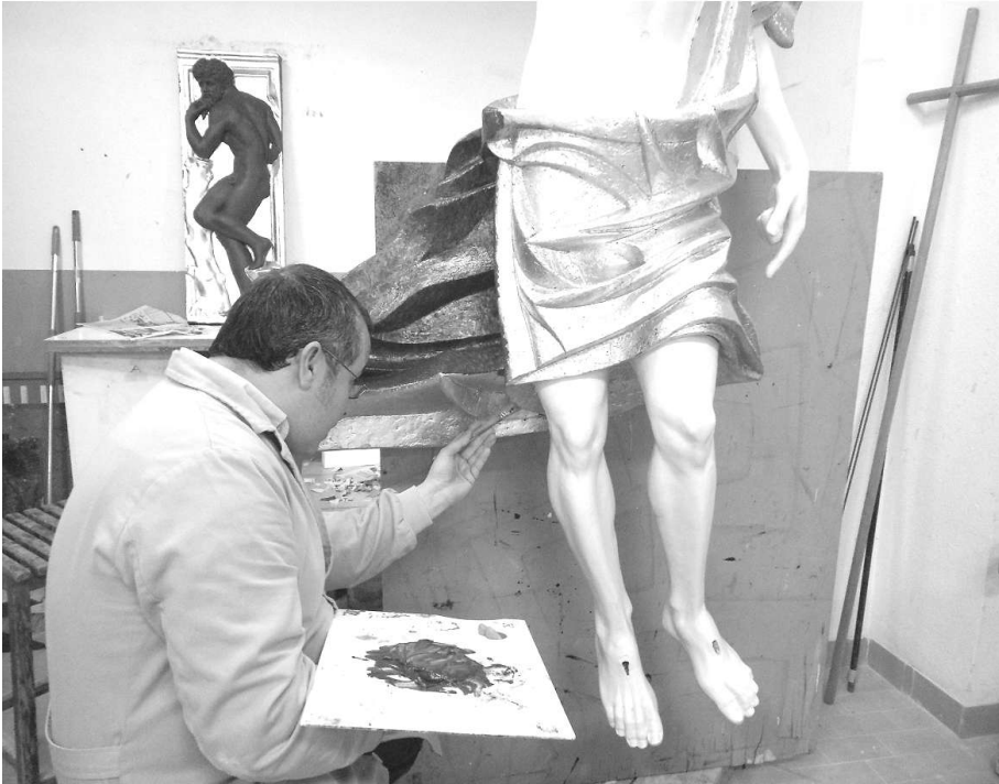
Fig. 9. Realización del estofado con temple al huevo sobre pan de oro

Con la imagen dorada y aplicado el tono base de la encarnadura, se procedió a la aplicación del temple para su estofado sobre la superficie metalizada. El tratamiento de las encarnaduras va enfocado a potenciar el volumen para dar profundidad al relieve superficial y para ello se ha recurrido a tonalidades frías favoreciendo de este modo el efecto de la pátina y el realce de la forma mediante el color. Las zonas más salientes de la anatomía del Resucitado han sido tratadas con tonalidades cálidas, potenciando visualmente las valoraciones que se observan en el estudio del natural con modelo vivo. (Figs. 10 -13).