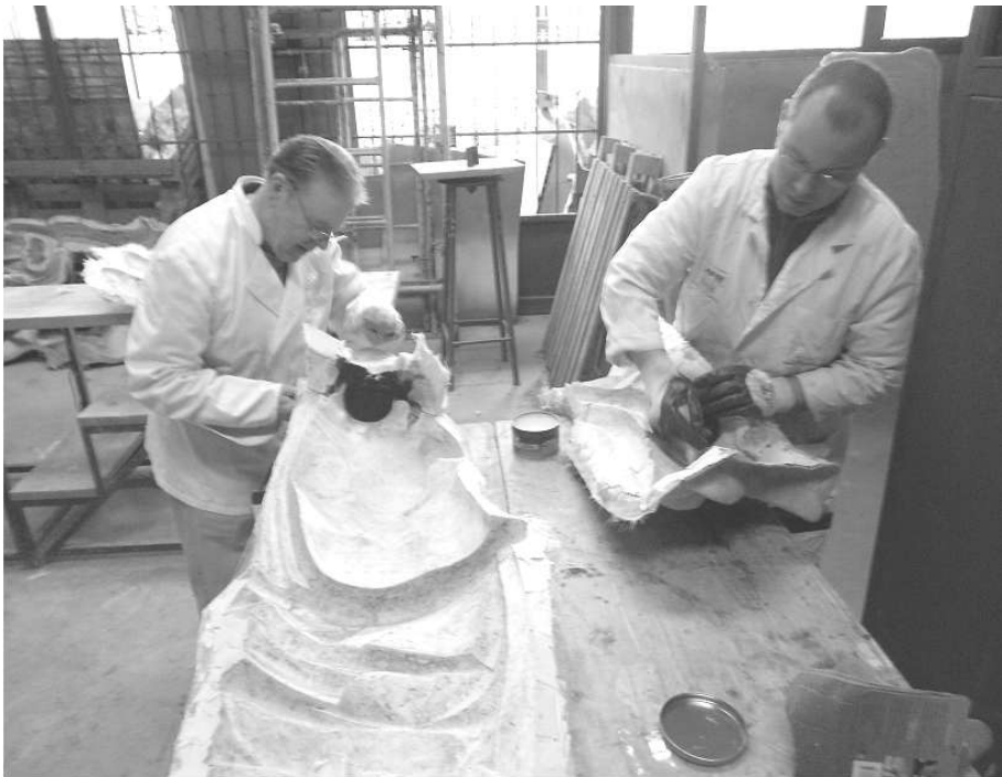
Fig. 7. Tratamiento del molde semi-flexible para positivar en resina de poliéster

Atendiendo a las características de la imagen y a su tamaño, hubo de emplearse un material de alta resistencia y poco peso, siendo la resina de poliéster el adecuado por cumplir plenamente todos los requisitos.