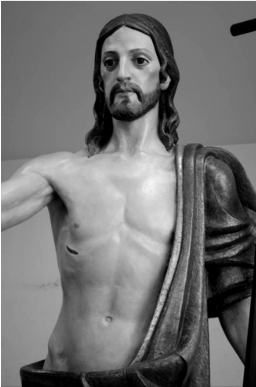
Fig. 12. Cristo Resucitado (Detalle)