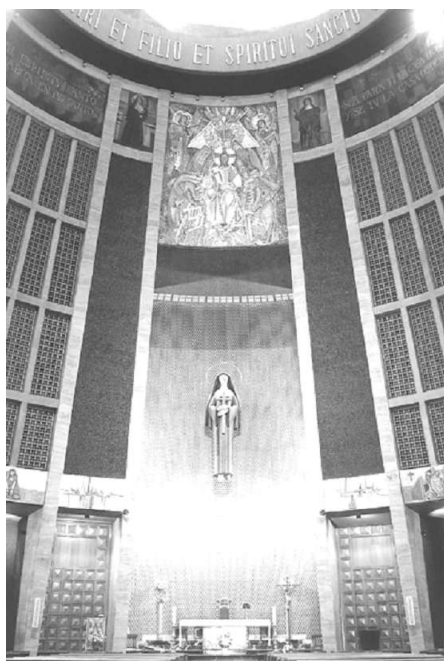
Fig. 4. Antonio Martínez Penella. Retablo de Santa Rita. (Madrid) 1959

Del mismo modo, en el proceso constructivo de las imágenes destinadas al culto aparecen nuevos materiales que por su naturaleza se han desvinculado de su operatividad funcional y se han adaptado a nuevas formas de expresión, en este caso el hormigón o el hierro forjado ejemplifican dicha incorporación con fines artísticos.