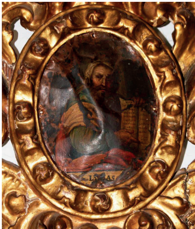
2. A. J. SÁNCHEZ FERNÁNDEZ. ÓLEO SOBRE COBRE. DETALLE DE LAS DEFORMACIONES MECÁNICAS. IGLESIA DEL CARMEN (ANTEQUERA, MÁLAGA)

La mayor fragilidad de la pintura sobre cobre está en la interacción entre la lámina de metal y la capa pictórica. Los levantamientos y la pérdida de policromía están más vinculados a los fenómenos mecánicos que químicos. Así, los levantamientos en escamas de la película pictórica se presentan frágiles y quebradizos. Además, entre las oquedades de las escamas pueden acumularse suciedad o sustancias de intervenciones de restauración. Las escamas de bordes rizados son el caso extremo que conduce a la caída final de la pintura. También existen levantamientos en forma de burbujas, que aunque parezca una patología localizada, son síntomas de patologías más extensas.