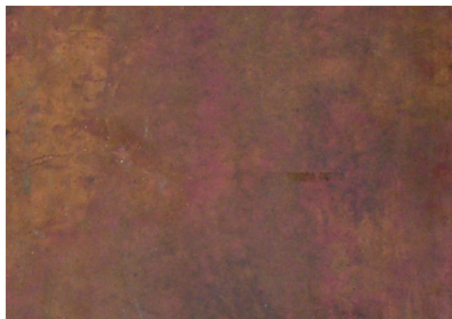
4. B. PRADO-CAMPOS. DETALLE DEL REVERSO DE UNA LÁMINA DE COBRE. SE APRECIAN DISTINTAS TONALIDADES EN LA SUPERFICIE. COLECCIÓN PARTICULAR

De esta manera, los cationes de cobre pueden ser atraídos por los aniones de azufre y/o carbonato que pudieran estar presentes en el agua, formando determinadas sales. Los carbonatos, insolubles en agua, cristalizan en superficie.