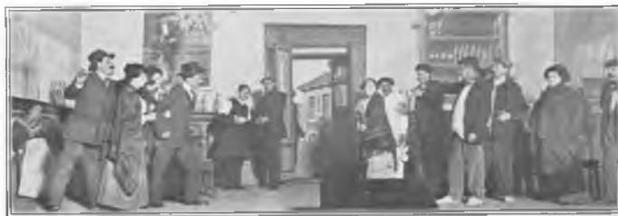
Final del primer acto de Juan José , interpretado por los artistas del teatro Español, literatos y periodistas.

Blanco y Negro dio a sus lectores una reseña con varias fotos de Rivero. En una doble página central