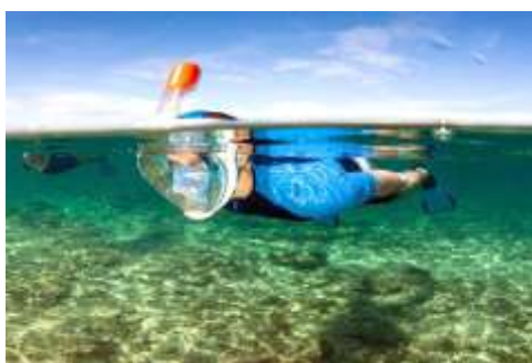
Figura 2.2. Snorkel

Dentro de esta modalidad encontramos una muy común llamada snorkel (ver figura 2.2.), el buceador sigue estando conectado a la superficie solo que esta vez lo hace mediante un tubo. Uno de los extremos siempre asomado sobre el agua para que entre el aire. El equipo es mínimo, además del tubo se precisa gafas y aletas. El atractivo principal es la oportunidad de observar la vida submarina en un entorno natural sin un equipo complicado y la formación necesaria para el buceo, durante largos periodos de tiempo con relativamente poco esfuerzo. El Snorkel es considerado más una actividad de ocio que un deporte.