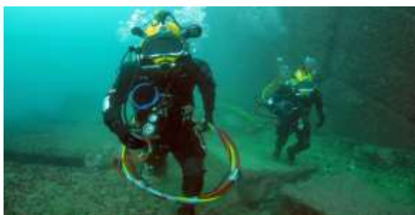
Figura 2.1. Buceo no autónomo

En esta categoría el buceador está conectado mediante una manguera a un equipo de aire que se encuentra en la superficie, lo que no le permite moverse con total libertad. Normalmente se practica con fines científicos (ver figura 2.1.). A pesar de que el buzo se encuentra muy limitado en cuanto a sus movimientos, los tiempos de inmersión son mucho más prolongados. Puede realizarse con la escafandra clásica Helmet o con equipo Hooka.