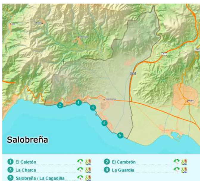
Figura 3.20. Principales playas de Salobreña