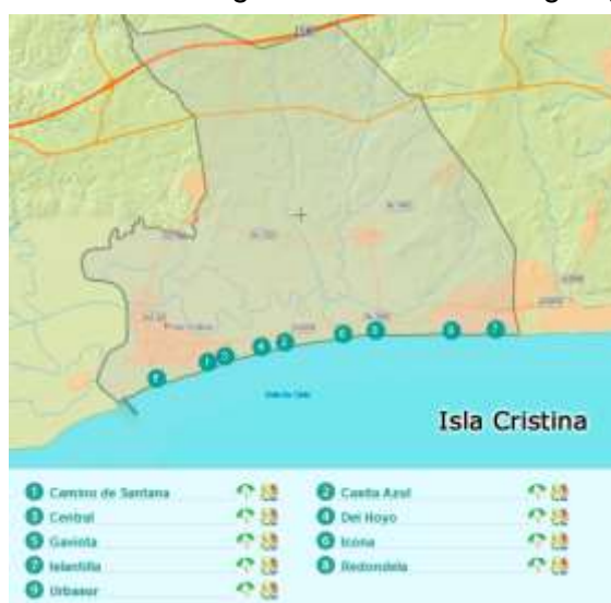
Figura 3.5. Principales playas de Isla Cristina

Isla Cristina (ver figura 3.5.) solo cuenta con Islasub no solo realiza inmersiones en el litoral onubense, también lo hace en algunas zonas de Portugal. (ver tabla 3.3)