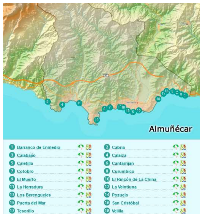
Figura 3.18. Principales playas de Almuñécar

Almuñécar (ver figura 3.18.) es el núcleo que cuenta con mayor número de empresas (13) (ver tabla 3.15.). Todas excepto Buceo Natura, tienen certificación PADI. Gran variedad de cursos y actividades debido a que la zona permite el desarrollo de casi todas las especialidades de buceo.