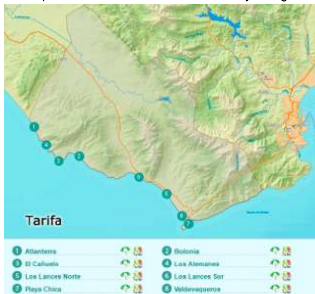
Figura 3.7. Principales playas de Tarifa

En el municipio de Tarifa (ver Figura 3.7.) se localiza el mayor número de empresas que ofertan actividades de buceo y otras relacionadas, un total de siete. Las actividades ofertadas se dirigen a todo el público y varias de ellas alquilan y venden equipo como actividad complementaria. Destacan empresas como Tarifa Cies que dispone de cursos más específicos como buceo de nitrox y fotografía (ver tabla 3.5.)