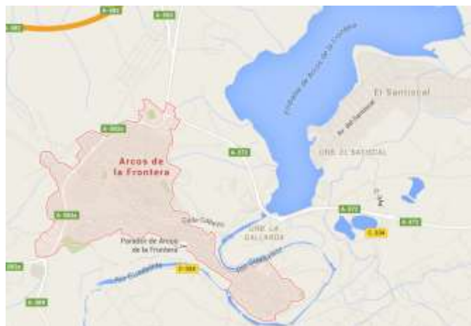
Figura 3.8. Arcos de la Frontera

En el municipio de Arcos de la Frontera (ver figura 3.8.) encontramos dos empresas de esta índole, una de ellas oferta cursos tanto PADI como FEDAS (ver tabla 3.6.), no obstante la empresa Adventure Sport Club Cádiz Buceo es mucho más completa ofreciendo una gran cantidad de cursos como el de primeros auxilios, buceo nocturno, fotografía y además destacan los cursos específicos para niños.