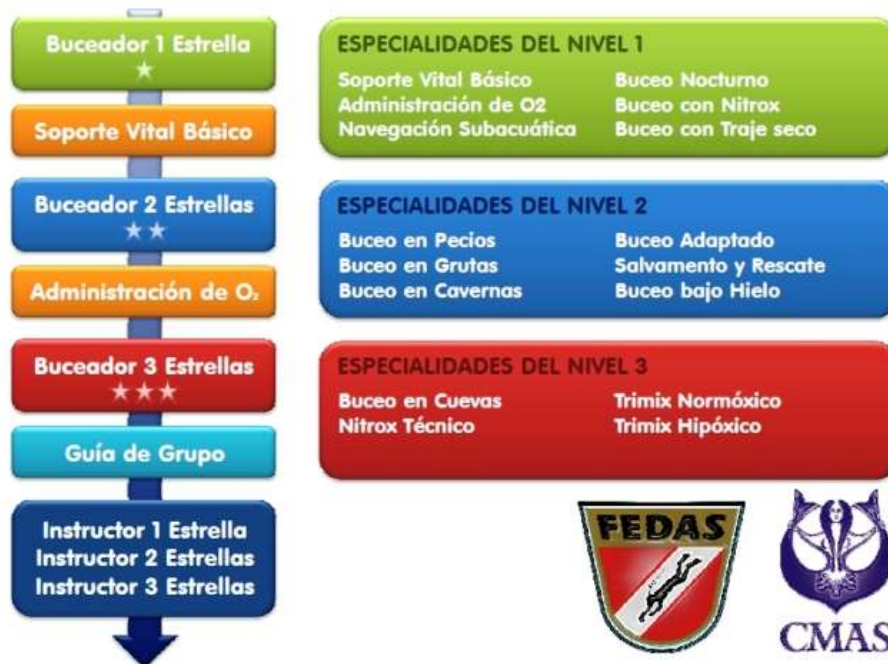
Figura 2.11. Tipología cursos FEDAS

Por su parte, los cursos de la FEDA (Federación Española de Actividades Subacuáticas), (ver figura 2.11), son los únicos cursos reconocidos por CMAS (Confederación Mundial de Actividades Subacuáticas) con equivalencia directa.