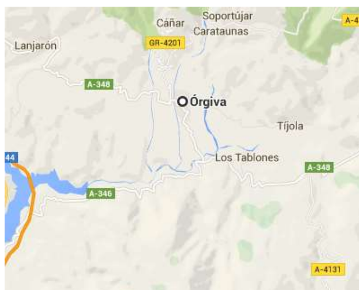
Figura 3.22. Órgiva

Ubicada en plena sierra (ver figura 3.22) está Alpujarra Experience Buceo (ver tabla 3.19.). De esta empresa destaca la complejidad de las inmersiones que realiza principalmente debido a la profundidad a la que trabajan.