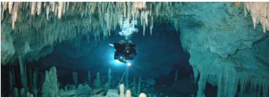
Figura 2.8. Espeleobuceo