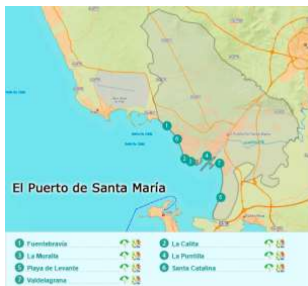
Figura 3.9. Principales playas de El Puerto de Santa María

El Puerto de Santa María (ver figura 3.9.) cuenta con dos empresas que ofertan actividades de buceo y subacuáticas (ver tabla 3.7.), ambas tienen cursos de todos los niveles, además ofrecen tipologías más concretas y opciones de buceo libre por grupos.