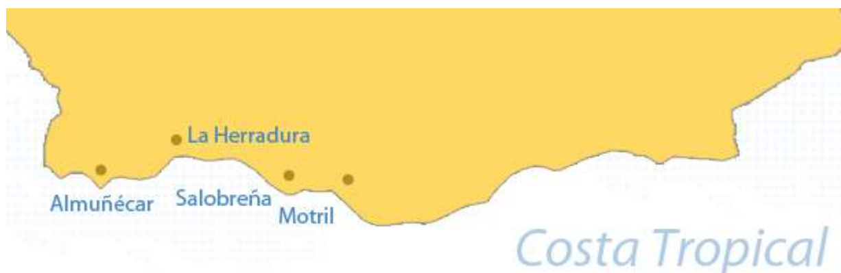
Figura 3.17 Playas costa de la Luz

Situada en el extremo meridional de la provincia de Granada (ver figura 3.16) está formada por diecisiete municipios. Por lo general, el litoral mediterráneo de la costa de Granada vive una intensa transformación de su paisaje debido en gran parte por el conflicto originado por el uso del suelo. Por un lado tenemos el importante desarrollo turístico y las promociones residenciales que está experimentando la costa; en el otro la expansión de una de las actividades económicas más importantes de la zona, la agricultura de invernaderos. A este trance, hay que añadirle el uso propio de las infraestructuras y la red de transportes.