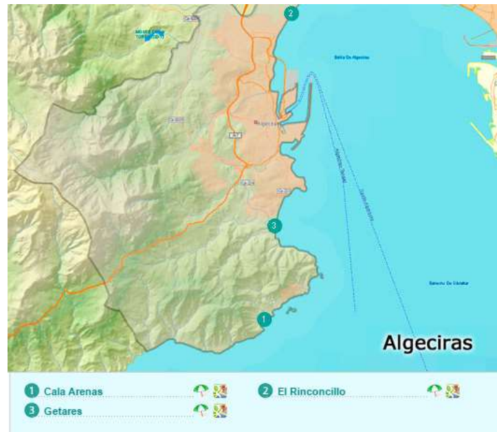
Figura 3.10. Principales playas de Algeciras