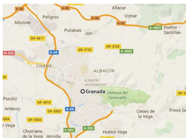
Figura 3.21. Granada

Lejos de la costa granadina (ver figura 3.21.) se ubican un total de 5 empresas (ver tabla 3.18.). Organizan salidas al litoral para la realización de inmersiones de varios niveles y con certificados PADI.