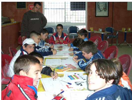
Grupo Motor de Torreblanca

Al acercarnos a la ciudad como construcción urbana, política, social, cultural y medioambiental podemos establecer dos grandes niveles de análisis, el que se relaciona con los grandes planes generales de ordenación urbana, de reforma interior, o de reconstrucción, que se realizan en estudios y oficinas de la administración o de arquitectos bien cualificados, y por otro lado, el nivel de lo cotidiano desde donde las personas humanizamos y damos vida a la ciudad, en todas las dimensiones que antes nombrábamos.