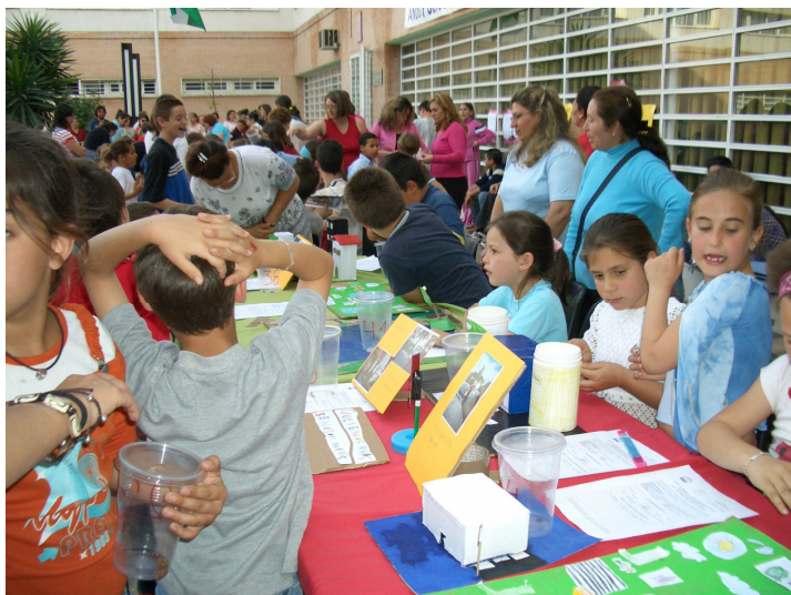
Asamblea sectorial de niñ@s, chavales/as y jóvenes – Polígono Sur

Se constituye a partir de ahora el grupo motor que será el encargado de velar por el desarrollo del proceso, ya que a través suya se analizan las propuestas, se elevan a la asamblea sectorial y se encargan de organizar todo el proceso asamblerio. La asamblea sectorial es el único órgano de decisión para las propuestas de niñ@s, chavales/as y jóvenes, de aquí emergerán las propuestas que posteriormente se votan en la asamblea de zona . El modo como se organiza este proceso es muy dinámico y divertido, ya que se trata de no hacer la participación tediosa y aburrida, que por otro lado no resta seriedad y rigurosidad al proceso de toma de decisiones, así planteamos un mercadillo de propuestas, en la que cada proponente desde su puesto realiza la propuesta y la explica a l@s participantes en la asamblea.