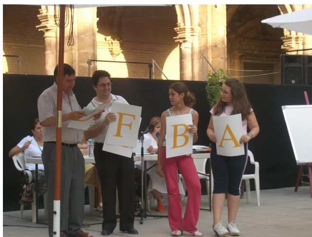
Asamblea de zona – San Jerónimo

✚ Ámbito social: existe una visión adultocéntrica que se convierte en el parámetro de construcción y organización de la vida pública, no siendo posible la participación l@s niñ@s, chavales/as y jóvenes en ningún espacio de decisión ciudadana. Sin embargo, esta visión se hace más liviana y flexible en las relaciones con los adultos como padres y madres, que cuando se plantea con los técnicos o políticos. Está despertando interés y confianzas entre quienes están participando desde el año anterior en el proceso, por significar un avance en procesos de participación, y la posibilidad de que se sumen más personas a los grupos mototes y asambleas. Sin embargo existe una visión paternalista que ningunea a un sector de población muy importante que por existir y ocupar un espacio social en nuestras calles, familias, mercado laboral, sistema de consumo, etc., tiene el derecho de ser tenido en cuenta.