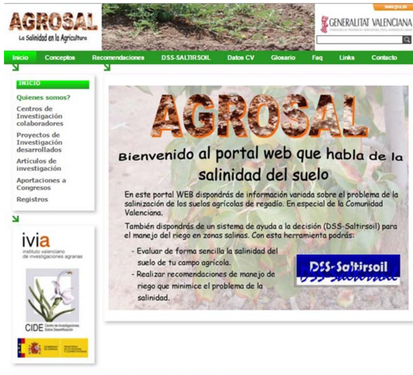
Figura 1. Entrada al portal AGROSAL.

una guía de manejo, un vídeo demostración y el propio sistema, bien pinchando en “Recomendación de Riego” bien en su logo. Así accedemos a una página donde nos identificamos con nuestras credenciales de usuario. En caso de ser nuevos en el sistema, antes de poder utilizarlo nos registraremos.