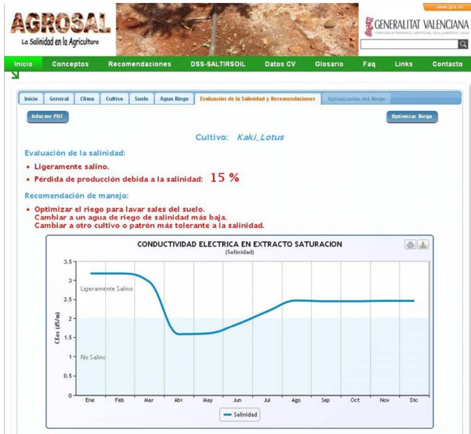
Figura 3. Pestaña «Evaluación de la Salinidad y Recomendaciones».