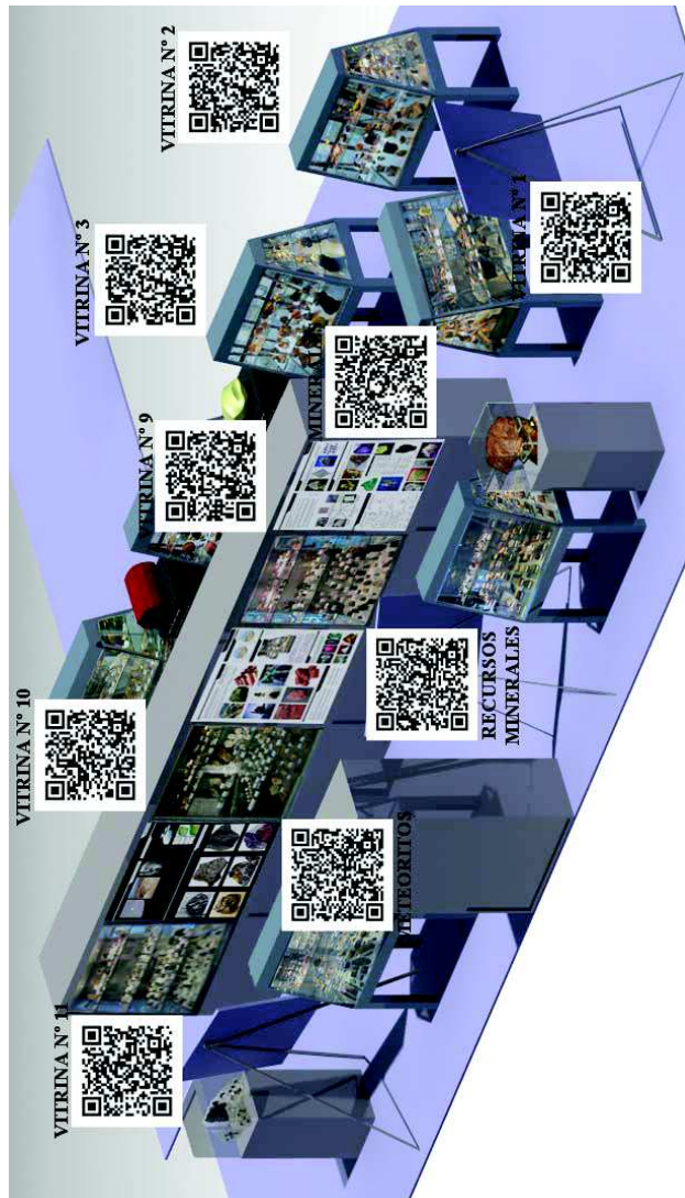
Figura 3. Visita virtual de la Exposición de Geología.

Actualmente existe una página web de la exposición ( http://investigacion.us.es/scisi/sgi/exposiciones ) y se está construyendo otra con información de los fondos del museo y de la exposición, a la cual se accederá mediante los QR. A partir de ella se podrá acceder además al material didáctico incluidos, creados por el propio Museo (paneles, trípticos,..). Se está elaborando una visita virtual a la exposición (Fig. 3) de tal forma que cada expositor contará con un código QR que permitirá al visitante ampliar la información de aquello que está viendo, guiándole y permitiéndole acceder a una mayor cantidad de información.