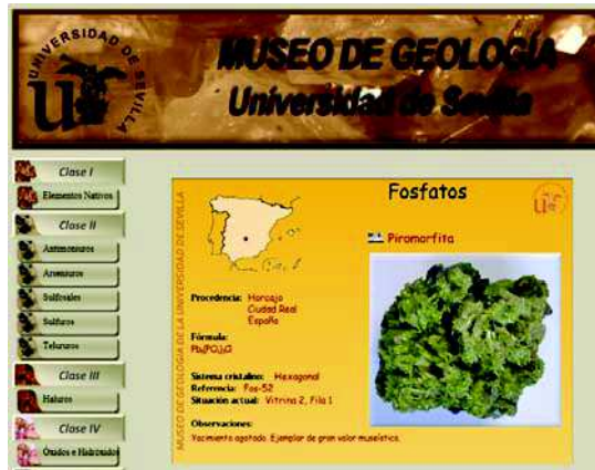
Figura 6. Detalle de una ficha a la que se accede a partir del ejemplar en la vitrina 2