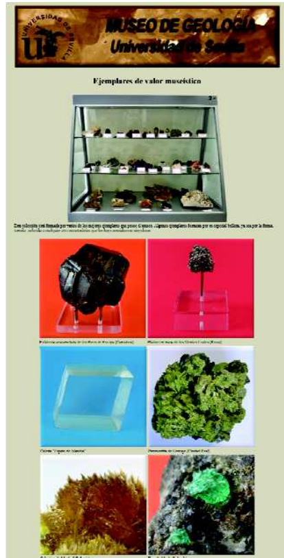
Figura 5. Vitrina n° 2 y vista parcial de su contenido

La Exposición del Museo de Geología ha sido posible gracias a la ayuda recibida desde el Vicerrectorado de Investigación y en particular desde la Dirección del Secretariado de Centros, Institutos y Servicios de Investigación. Las ayudas del Plan Propio de Investigación han hecho posible el desarrollo de distintas actividades desde la inauguración de la Exposición.