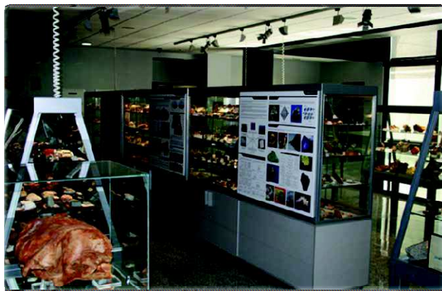
Figura 2. Vista general de la Exposición.

Como complemento se presentan una serie de posters que recorren la Historia del Museo y sus personajes, la Historia de la Tierra, la Estructura y Teoría de Tectónica de Placas, la Formación y Clasificación de los Minerales, de los Fósiles y las Rocas, el origen de los Meteoritos y las Aplicaciones Industriales de los Recursos Minerales. Con estas ilustraciones se pretende introducir al visitante en el mundo de la Geología y en particular de los procesos