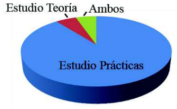
Figura 1. Uso del museo por parte del alumnado.