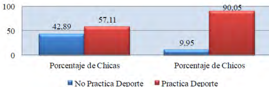
Gráfico 2. Nivel de práctica en función del género

A continuación se presenta los porcentajes de prácticas deportivas en función del género así como los porcentajes de los deportes más prácticas tanto por hombres como por mujeres. En primer lugar, se representa el nivel de práctica extraescolar en función del género, donde se aprecia cómo el índice de práctica masculina es superior al porcentaje de práctica deportiva de las chicas. Concretamente, el 90% de los chicos que participaron en el proyecto indicaron que estaban inmersos en alguna actividad deportiva organizada fuera del horario escolar, mientras que en el caso de las chicas este porcentaje sobrepasó ligeramente el 57%. Por el contrario el 42% de las chicas no practican deporte frente al 10 % de los chicos.