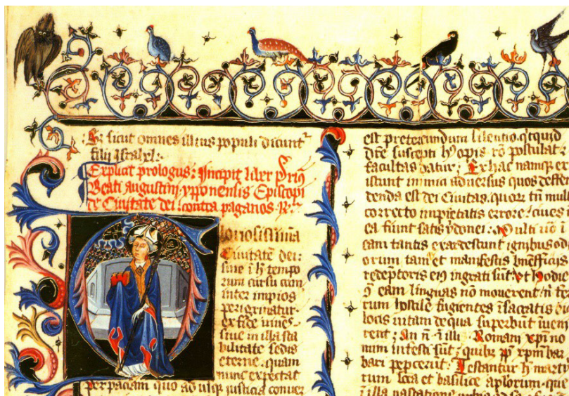
Figura 2. El Burgo de Osma, Cabildo Catedral, De Civitate Dei, primer tercio del siglo XIV.