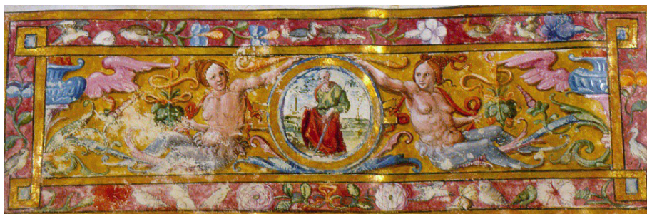
Figura 10. Catedral de Córdoba, Ms.64, folio 1 v., Diego Dorta, segunda mitad del siglo XVI.