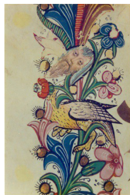
Figura 7. Catedral de Sevilla, libro de coro 33, folio 1 v., Pedro de Palma, 1521.