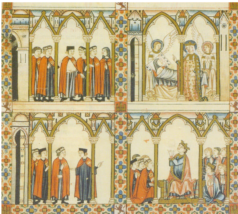
Figura 6. Cantiga 78: La Orden de Santa María de España (Cód. B.R. 20, f. 100, Biblioteca Nacional de Florencia).