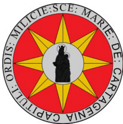
Figura 5. Sello de la Orden Militar de Santa María de España o de la Estrella.