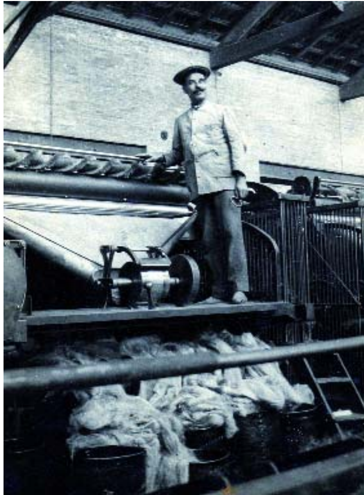
Un maestro hilador posa junto a la maquinaria en 1910. La población obrera fue objeto preferente de la educación para adultos, que se celebraba de 19 a 21 h.