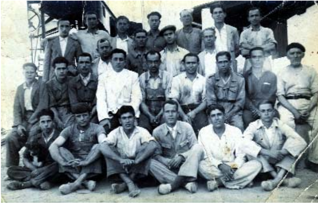
Fotografía de familia de un grupo de obreros. En la década de los años 20 se propició el asociacionismo gremial entre albañiles, jornaleros o barberos.

hizo a Dos Hermanas en 1913, donde impartió una conferencia en la Sociedad de Agricultores titulada Por la educación racional gozaremos de los beneficios de las ciencias y la libertad . En ella se expusieron los principios de la enseñanza sin dogmas, ni sistemas o moldes, donde se aplica la coeducación, se siguen las ideas de Ferrer y se animó a los asistentes diciendo: “Trabajadores, reflexionad sobre lo expuesto, fijaos detenidamente en vuestra situación y comprenderéis la necesidad de establecer escuelas racionalistas en todas partes”.