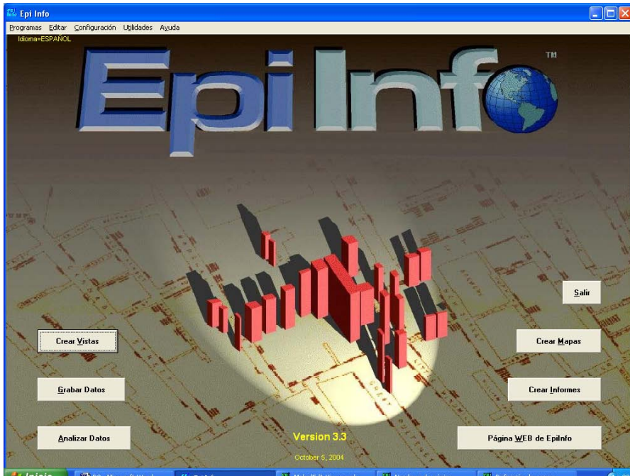
Figura 1: pantalla principal de Epi Info.

para conseguir la última versión, instalarla en el ordenador y comenzar a utilizarlas, sin los habituales problemas de licencia.