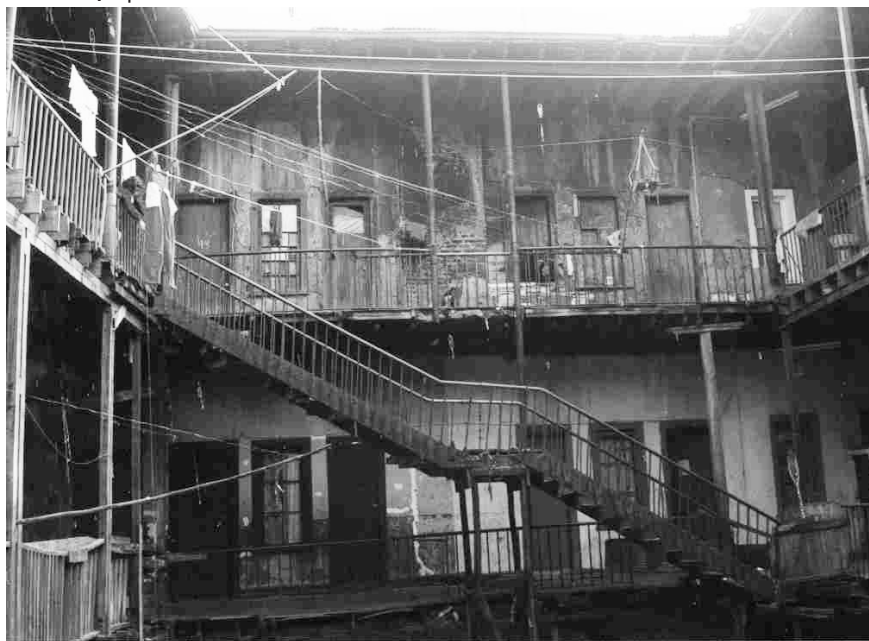
FIGURA 4 | Población Obrera de la Unión