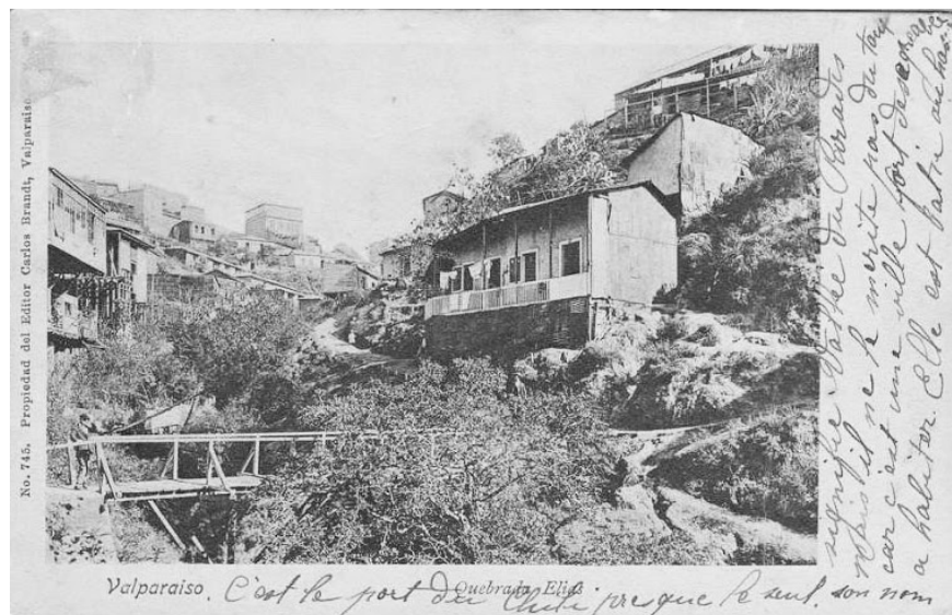
FIGURA I | Autoconstrucciones en la quebrada Elías, Valparaíso, 1892

provocadas por los temporales y la carencia de agua potable limpia fueron el caldo de cultivo perfecto para las numerosas infecciones que no tardarían en llegar (Molina, 2008, p. 205). Esta situación se transformó en una constante. Es refiriéndose a ella que el Consejo Departamental de Higiene señalaba en 1893: “Por las inundaciones ocasionadas por las últimas lluvias y los peligros de aparición de alguna epidemia, se acordó indicar la necesidad de prohibir que se habiten las casas, conventillos y cuartos que fueron inundados. Todos ellos han quedado insalubres e inhabitables” 2 .