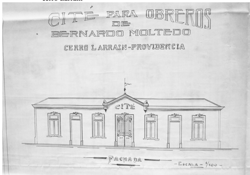
FIGURA 2 | Proyecto de cité para obreros, encargado por Bernardo Molledo en el cerro Larrain