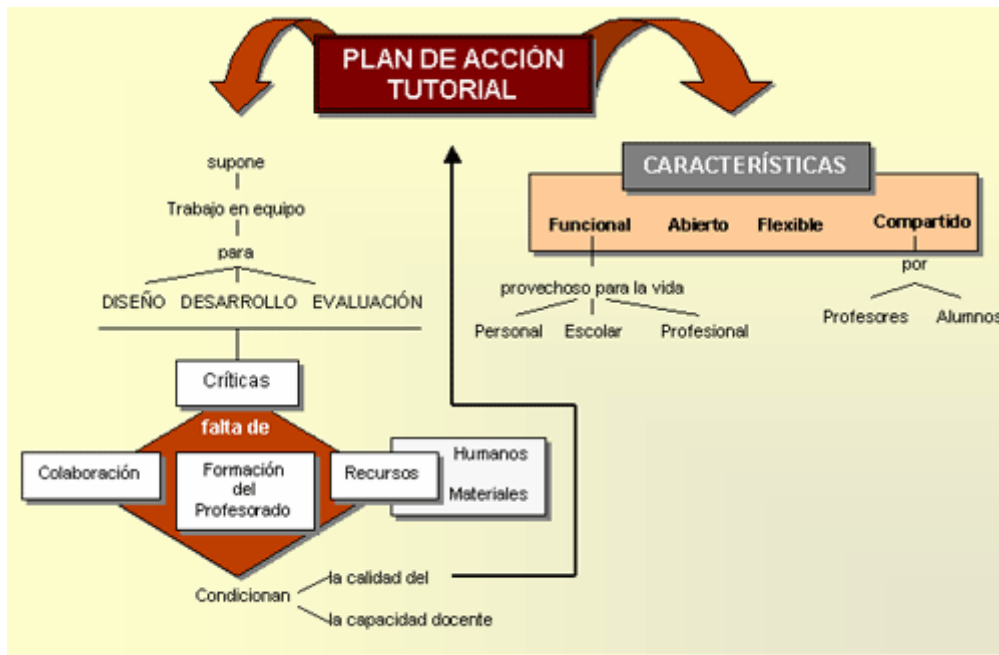
Figura 1. Plan de Acción tutorial

Igualmente se reconoce, en las distintas manifestaciones de los Orientadores, que los Centros necesitan estar dotados de los recursos materiales y personales necesarios para afrontar con garantía el reto de la orientación: “...para orientar se requieren los recursos mínimos que permitan el desarrollo de las actividades propuestas en el Plan de Acción Tutorial...” (Ent.031).