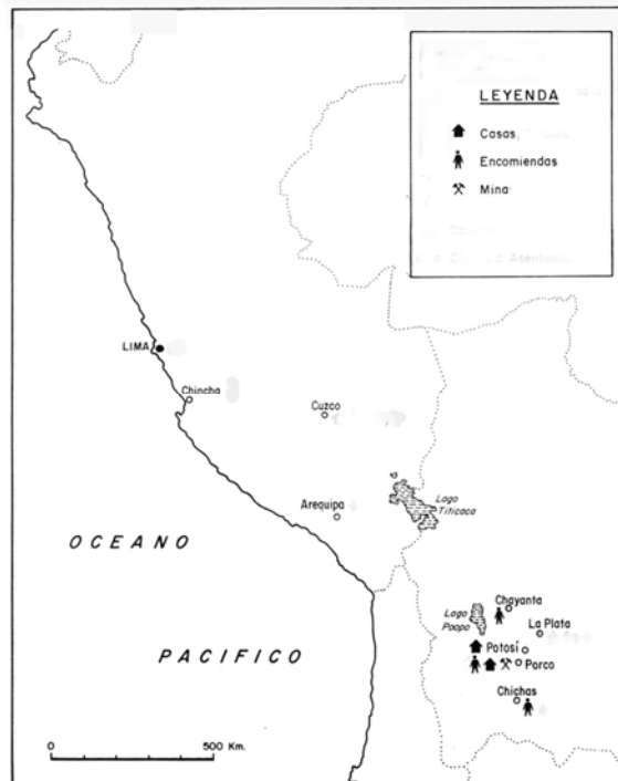
Foto 2. Mapa de situación de los territorios administrados por Baltasar Velázquez.