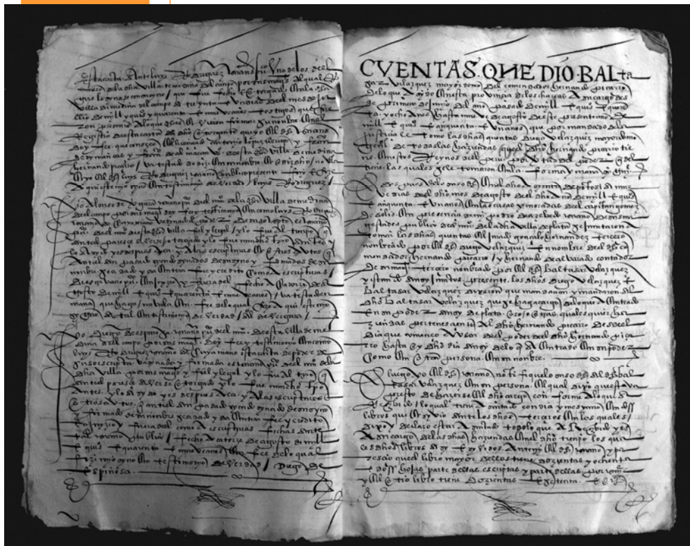
Foto 3. Cuentas de Baltasar Velázquez sobre la hacienda y minas de Porco.