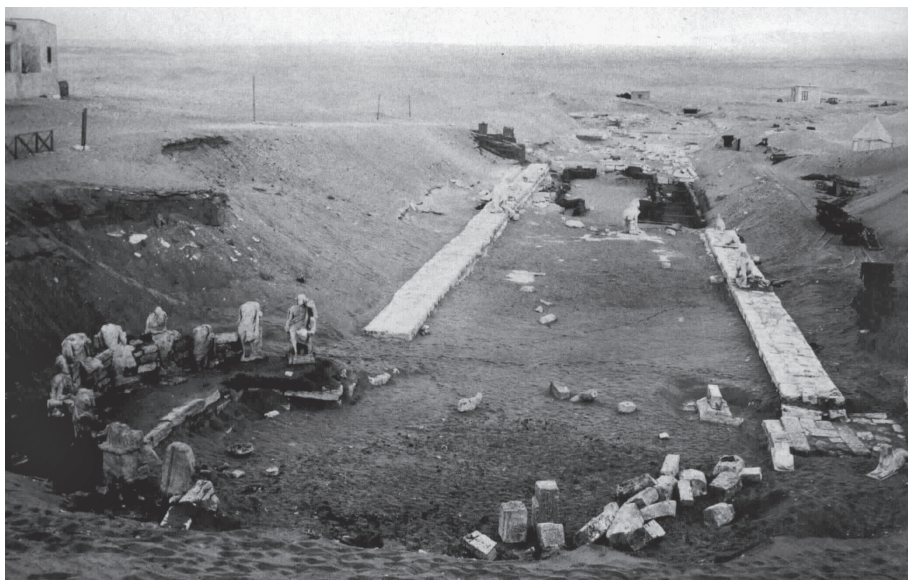
Figura 4. Hemiciclo de los Filósofos del Serapeum de Saqqara (Lauer y Picard 1955).