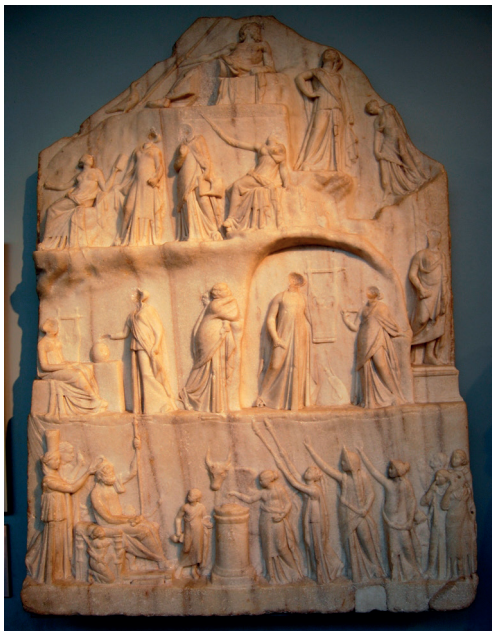
Figura 3. Apotheosis de Homero , s. III a.C. Londres, British Museum

como posibles bibliotecas o auditoria , dotadas ambas de sus propios edículos 67 . Fabrizio Slavazzi añade la posibilidad de vislumbrar en el Edificio M el gimnasio que las excavaciones todavía no han localizado en el yacimiento, y en cuyo interior quedaría integrado el Mouseion mencionado en una inscripción 68 . La dificultad de tipificar la construcción de Side entronca con la existencia física en las ciudades de instituciones decantadas hacia la cultura, en las que se imbricaban las diligencias eruditas, la investigación científica y la pedagogía municipal, provistas de auditorios, bibliotecas, espacios de ejercicios físicos, y que en este caso ha dado pie a su interpretación como un gimnasio, una biblioteca o, parcialmente, un