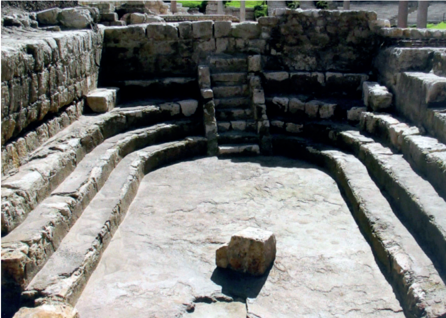
Figura 8. Auditorio K (McKenzie 2007).

estudiantil internacional que recalaba en Roma, y que el decreto del 370, aludido atrás, procedía a supervisar. Puesto que el pretendido complejo del Athenaeum no se ha sacado a la luz en su totalidad, podría todavía deparar más sorpresas, y corroborar o desmentir si como tipología arquitectónica se juzgó idónea su reproducción en el extremo oriental del Mediterráneo.