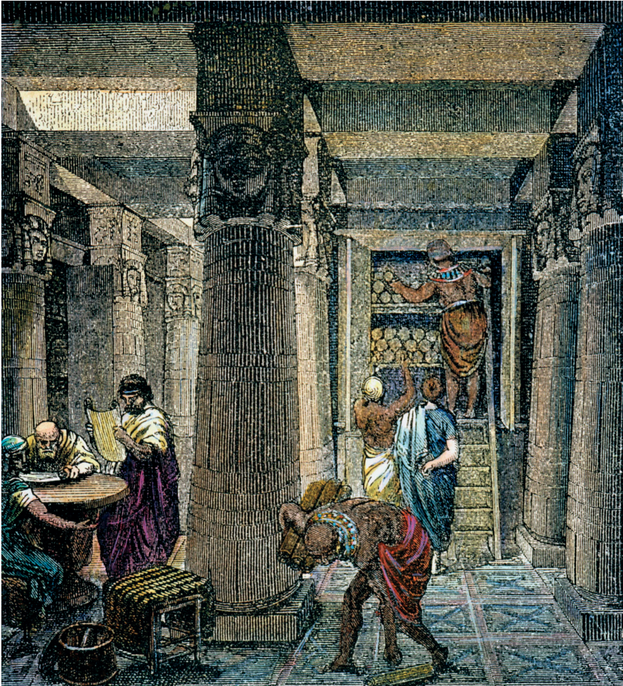
Figura 2. Grabado de la Biblioteca Real de Alejandría, s. XIX.

todos los años, y de principio a fin, los veinte libros de historia etrusca, y los ocho de historia cartaginesa, compuestos por él mismo 61 . Dichas salas de recitación pública existían con precedencia a la remodelación de Claudio, pero quizá la meta de ésta se dirigía a acrecentar las áreas dedicadas a la educación. Durante su existencia, del mismo modo que realizaron los monarcas helenísticos, los emperadores contemplaron el templo de las Musas como una empresa dependiente del Estado, nombraron directamente a sus miembros, les costearon su estipendio y decretaron exenciones fiscales a su favor. En casos como los de los sofistas Polemón de