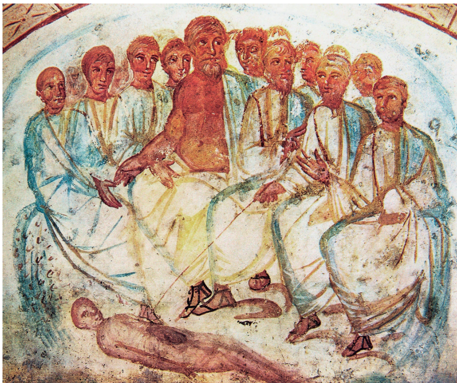
Figura 1. Lección de anatomía , s. IV d.C. Roma, Catacumbas de la Vía Latina

gimnasios, y como alentadores de su mismo alzamiento, se detecta el trasfondo de los cultos heroicos y funerarios, y la veneración de las figuras divinas. Desde el punto de vista topográfico, en los gimnasios de Corinto y de Asopo encuentra una correlación ritual con el Asclepieion (en el interior del segundo se han descubierto reliquias dedicadas al dios) que le persuaden de una dependencia que supera la mera piedad habitual dentro de estas instituciones, y que traslada al hecho fundacional 32 . Que los templos consagrados al dios de la medicina se localizaran, además, dentro de los gimnasios, no sería una eventualidad infrecuente, según se lee en Elio Aristides y en Filóstrato para el caso de Esmirna, cuando la estrecha vinculación de Asclepio con el ámbito pedagógico se estrechara todavía más a partir de época romana, al actuar el divino hijo de Apolo como protector del ejercicio físico 33 .