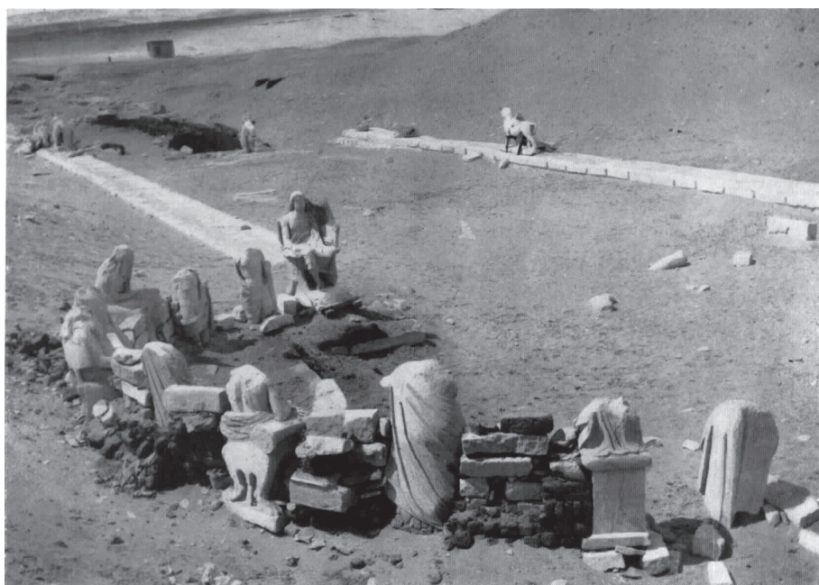
Figura 5. Hemiciclo de los Filósofos del Serapeum de Saqqara (Lauer y Picard 1955).