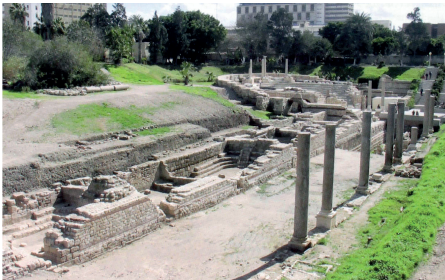
Figura 7. Pórtico y auditorios de Kôm el-Dikka (Majcherek 2007).