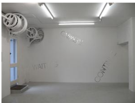
Fig. 1 Robert Barry. Inert Gas Series . Hardy. 2011/02/09 14:24

La publicidad, el consumo de masas, la producción en serie o la dimensión temporal de la percepción han contribuido a desdibujar definitivamente las fronteras entre las artes 13 ; prueba de ello son artistas relevantes como John Cage o Dan Graham 14 . En este contexto se enmarca el Arte Conceptual 15 con una reafirmación de la idea artística sobre la obra materializada 16 . El proceso creativo y la terapia artística son interpretados entonces como la pretensión de abarcar cualquier tipo de manifestación artística, incluso aquellas más novedosas que implican la participación de diferentes géneros artísticos y que por ello escapan a cualquier tipo de clasificación convencional. En la misma línea, las propuestas radicales de Robert Barry hacían uso de fenómenos físico-químicos no perceptibles como ondas radioeléctricas en una búsqueda de inmaterialidad 17 , en trabajos como Inert Gas Series o Radiation Pieces . Michael Asher, por su parte, en sus Airworks (1969) experimenta en varios trabajos con aire a presión y en los años setenta con intervenciones arquitectónicas 18 y Hans Haacke 19 , en sus Kondensationswürfel realizados entre 1963 y 1965, experimentaba con sistemas biofísicos utilizando cubos de plexiglás llenos de agua con diferentes condiciones de luz y temperatura.