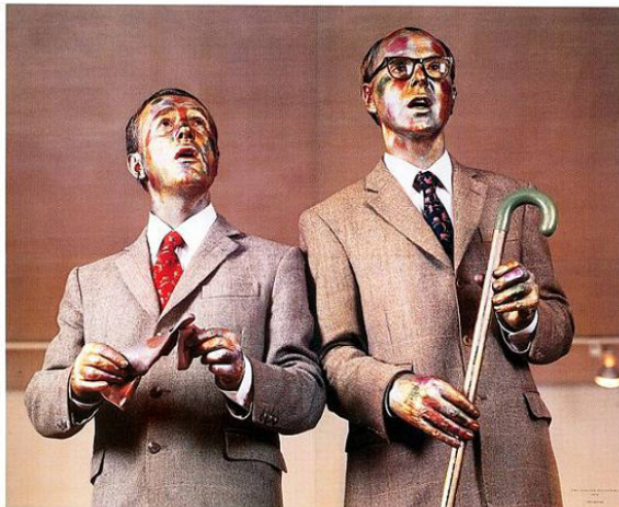
Fig. 3 Gilbert and George, "The Singing Sculpture", 1970

adecuada o fructíferamente a partir de la idea de obra de arte, consiguiendo aunar arte y vida. El dúo de artistas Gilbert & George se declaró “esculturas vivas” y defendió un arte antielitista en sus numerosos textos, dibujos y fotografías, pero sobre todo en performances como la famosa Singing Sculptures (1969). (fig. 3)