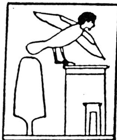
Figura 3.- Representación iconográfica egipcia del ba con cuerpo de pájaro y cabeza humana (el alma retornando a la tumba).

Cada vez son mayores los esfuerzos por realizar investigaciones sobre materiales que forman parte o están relacionados