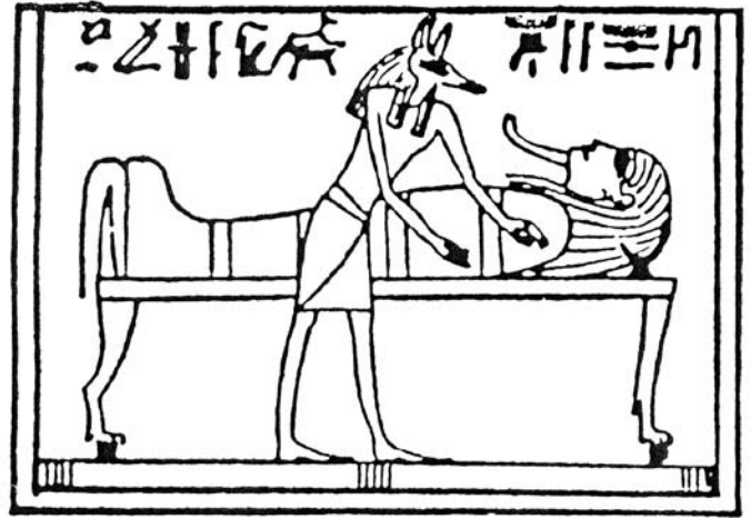
Figura 2.- Representación iconográfica del dios Anubis con cabeza de chacal como momificador.

En el Museo Egipcio de El Cairo (18) existen dos ejemplos muy parecidos al estudiado. Uno procede de la zona de Sakkara, en el que se ve claramente cómo Anubis sostiene el corazón del difunto sobre la palma de la mano izquierda (20). Por tanto, aunque este detalle falte en la incrustación en vidrio estudiada, puede suponerse que quizás lo llevaría. El otro ejemplo está realizado en vidrio opaco de color blanco (21). Otra pieza muy similar a la estudiada es un amuleto en vidrio procedente de la zona de Dendara; está realizado en vidrio azul y con pintura negra, fechándolo Petrie (22) en época ptolemaica.