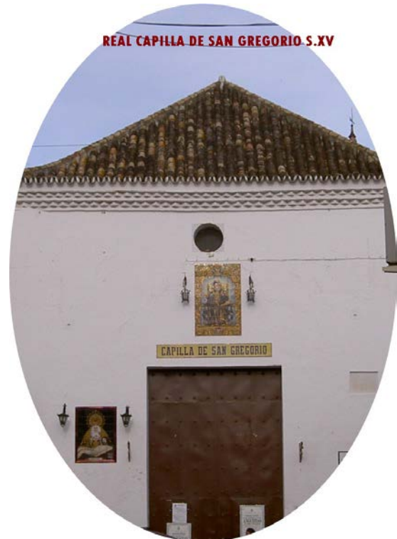
Real Capilla de San Gregorio de Osset de Alcalá del Río (Sevilla)