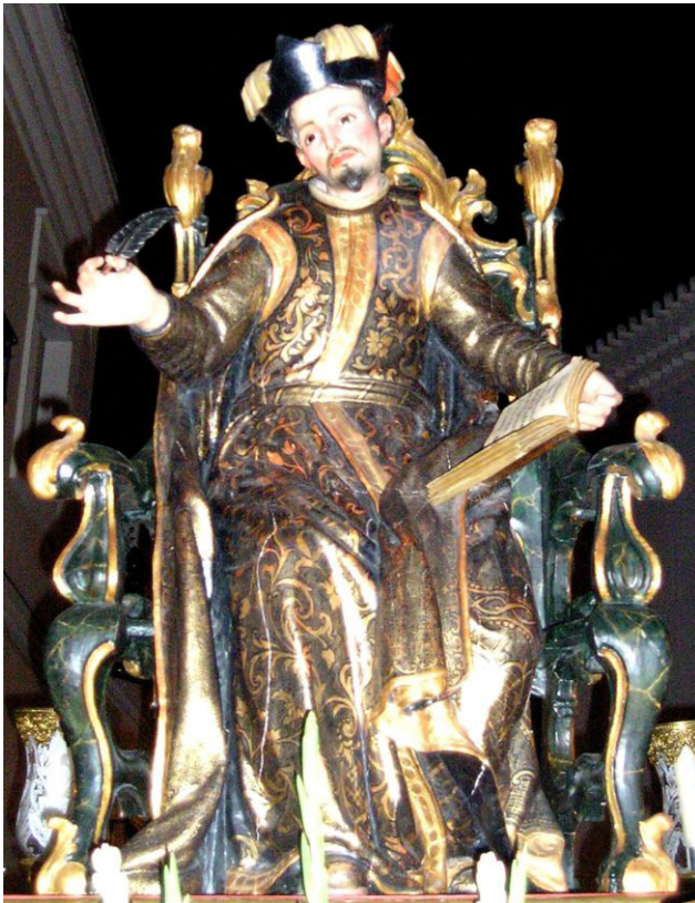
Imagen de san Gregorio Osetano donada por los hermanos García Merchante en el siglo XVIII.