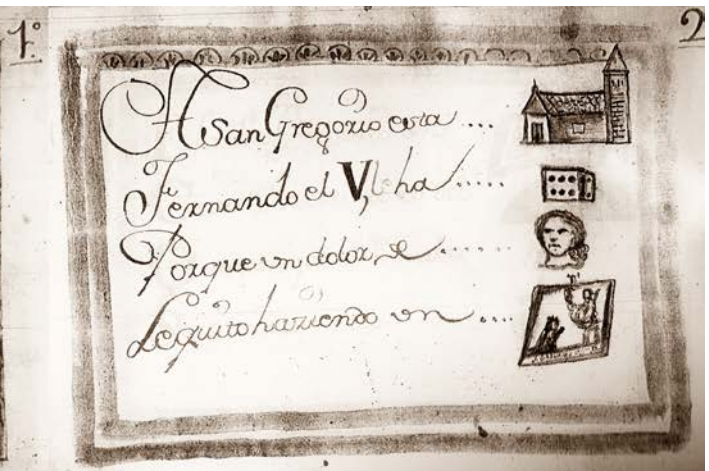
Dibujo jeroglífico realizado por Marcos García Merchante.