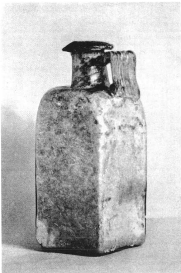
FIG. 2. Botella de vidrio procedente de sus excavaciones en Itálica. Siglos I y II d.C.