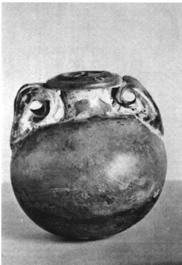
FIG. 3. Aryballos de vidrio procedente de sus excavaciones. Fines del siglo I d.C.