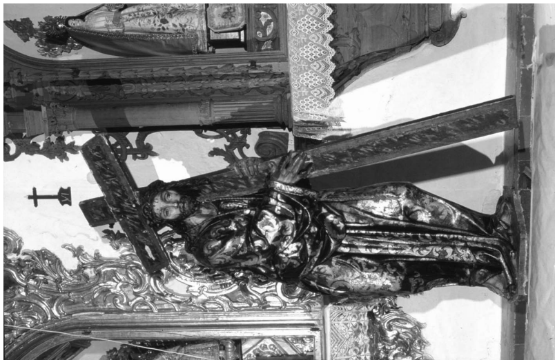
Figura 3. Gaspar del Águila (atribución). Nazareno. 1573. Monasterio de la Purísima Concepción. Mairena del Aljarafe (Sevilla).