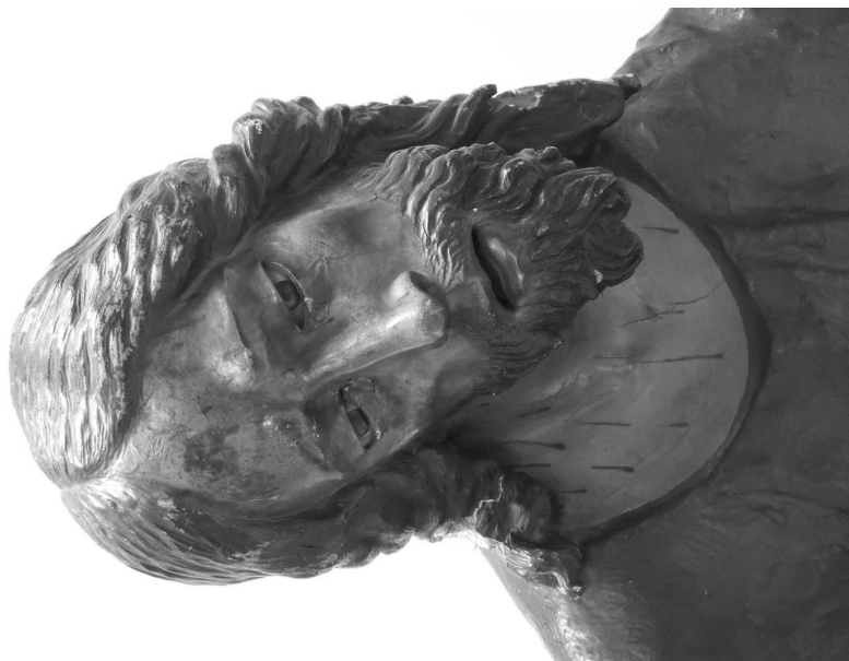
Figura 4. Nazareno de las Fatigas. Detalle de la cabeza.