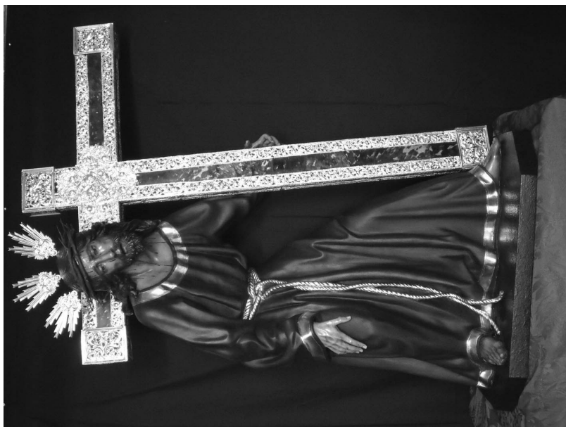
Figura 7. El Nazareno de las Fatigas tras su restauración por Francisco Berlanga de Ávila.