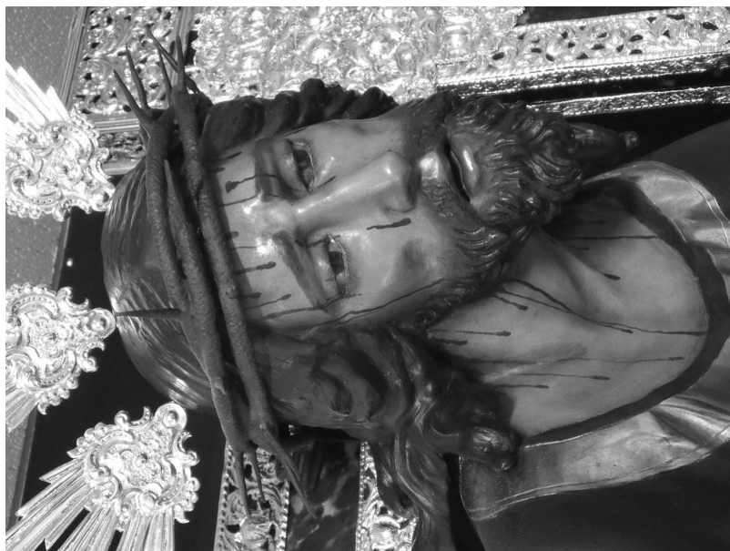
Figura 9. Cabeza del Nazareno de las Fatigas con su nueva corona de espinas.