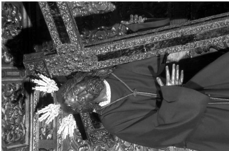
Figura 6. Nazareno de las Fatigas revestido con túnica lisa.