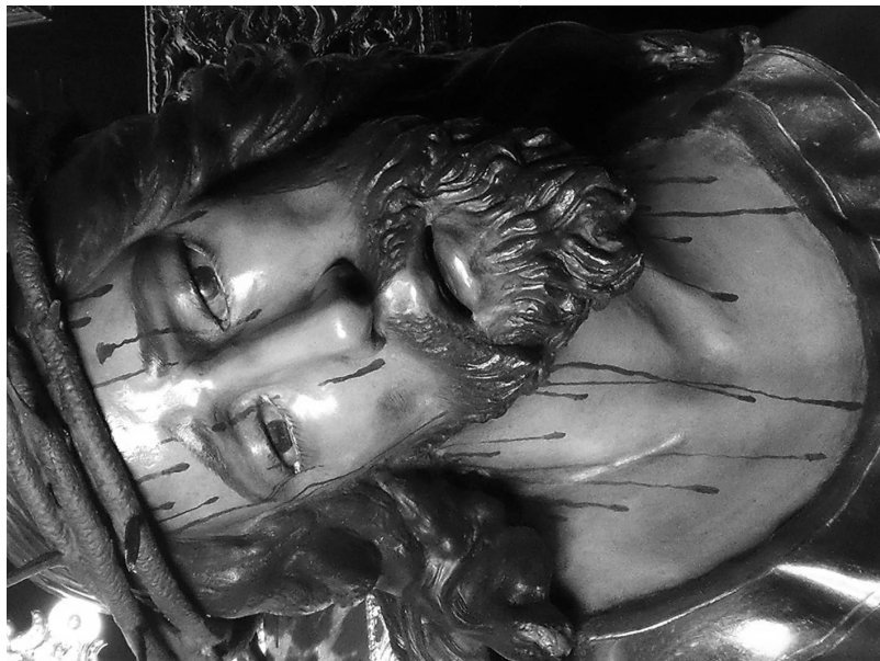
Figura 10. Rostro del Nazareno de las Fatigas, tras la última intervención restauradora.