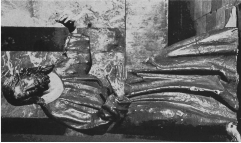
Figura 2. Gaspar del Águila. Nazareno de las Fatigas. 1587. Parroquia de Santa María Magdalena. Sevilla.