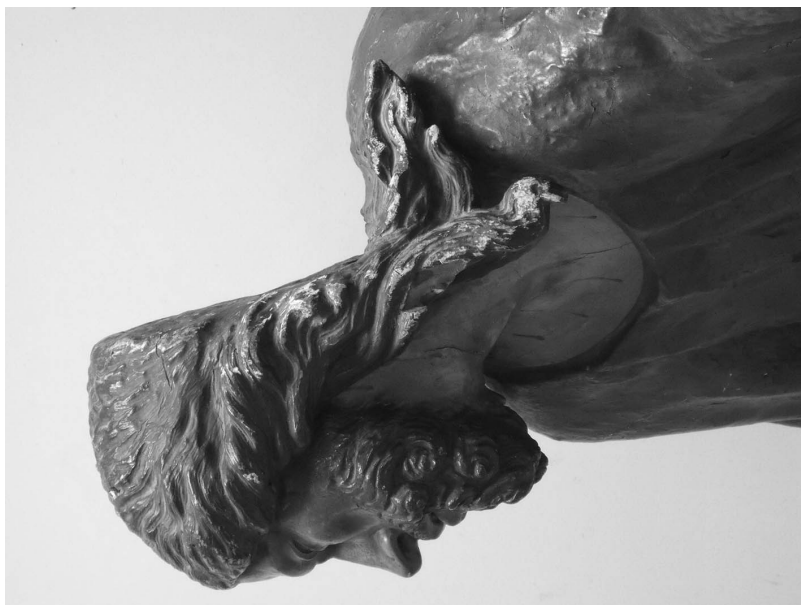
Figura 5. Perfil del Nazareno de las Fatigas, “de más que medio relieve”.