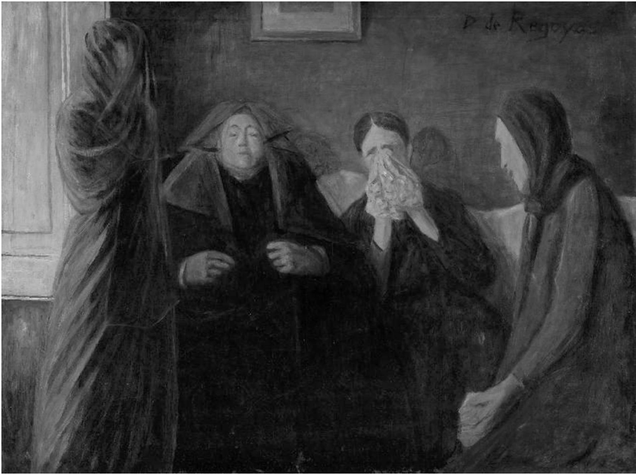
Figura 8. Darío de Regoyos. Visita de condolencia .