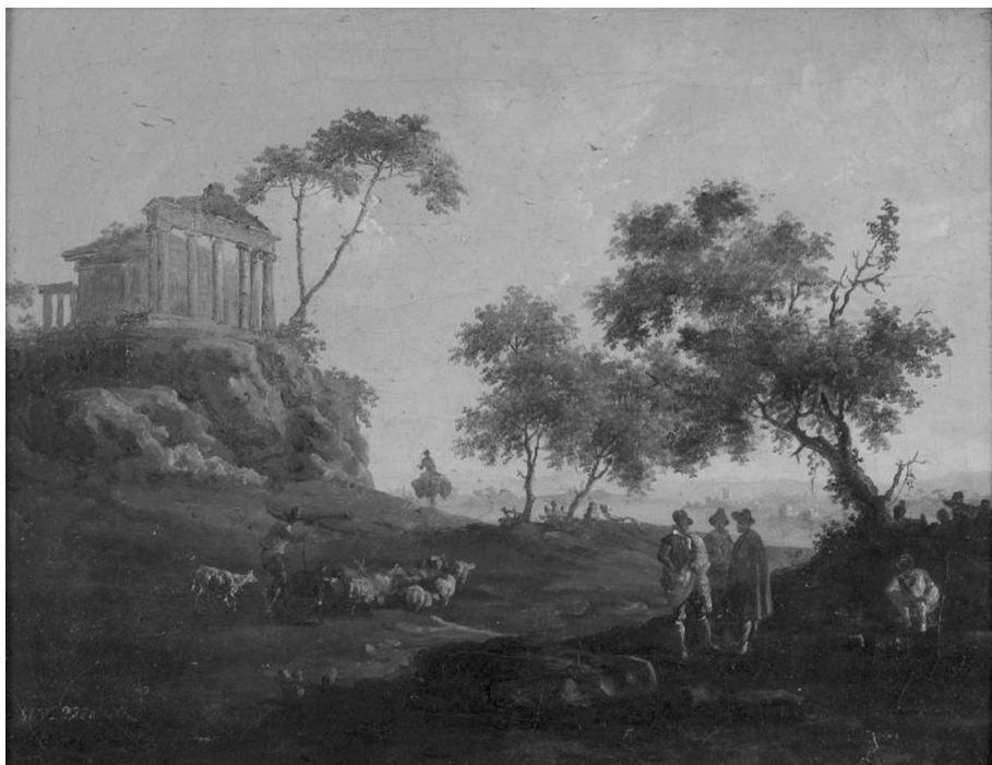
Figura 1. Jenaro Pérez-Villaamil, El verano .