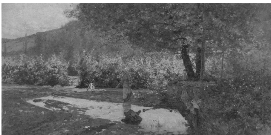
Figura 6. Serafín Avendaño. Paisaje con campesina.