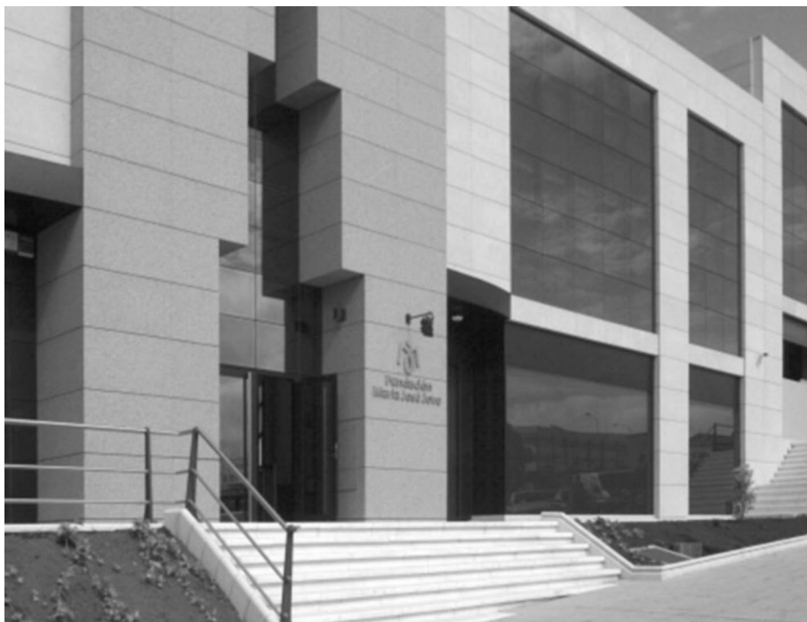
Sede de la Fundación.