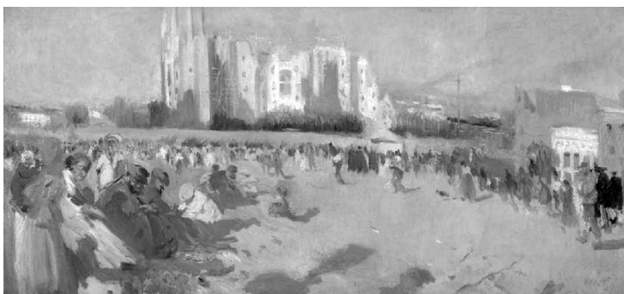
Figura 10. Joaquim Mir. La Sagrada Familia en construcción .