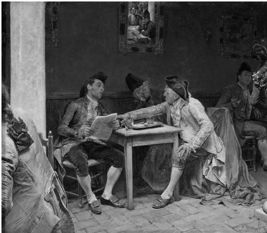
Figura 3. J. Jiménez Aranda. Los políticos .