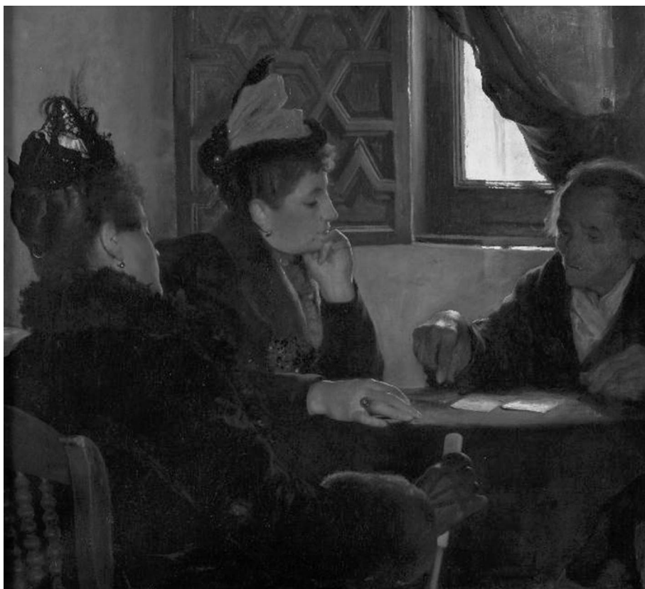
Figura 4. J. Jiménez Aranda. La echadora de cartas .