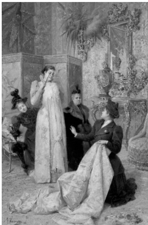
Figura 9. Francesc Masriera. La marchande de mode .