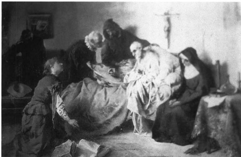
Fig. 4. Las postrimerías de Cervantes . 1892. En el mercado en 1996.