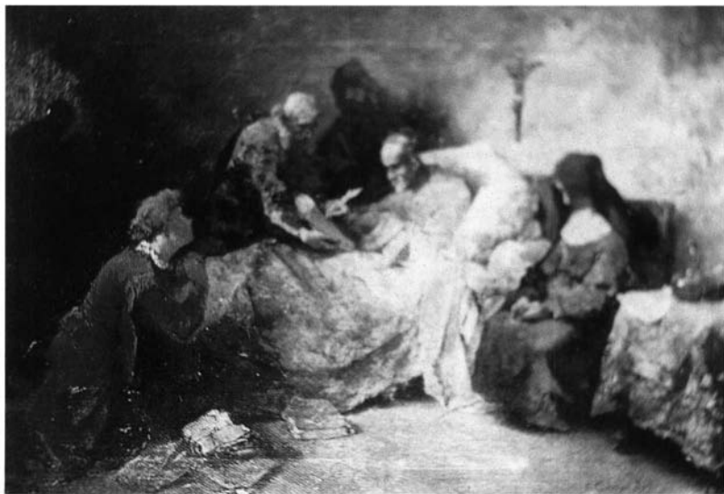
Fig. 3. Últimos momentos de Cervantes . 1887. En el mercado en 1999.