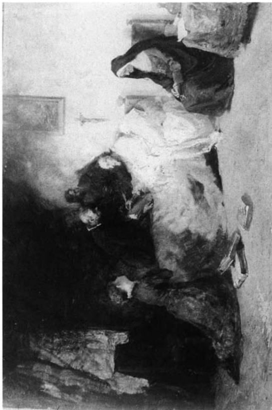
Fig. 2. Los últimos momentos de Cervantes , 1879. Col. particular.